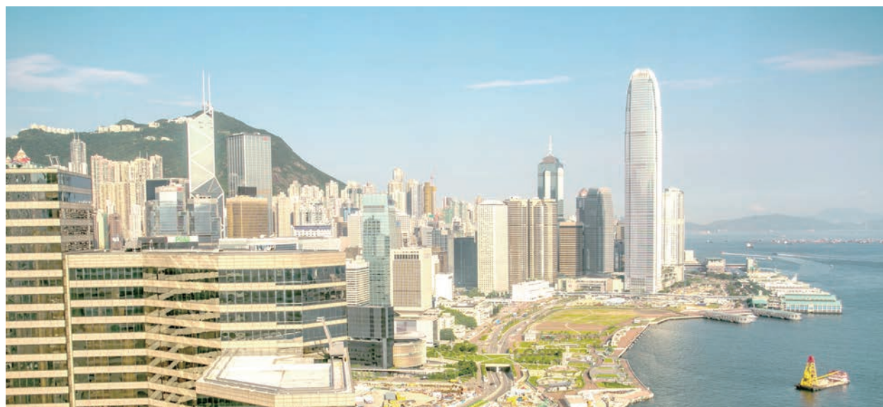
香港政府嚴格的邊境防疫政策引起外資恐慌，預計大量外資公司和人才會離開香港。（看中國）

歐洲商會的報告認為，香港這種「與世隔絕」的狀態，或要等到中共研發出 mRNA 疫苗，並已為 14 億人口接種後才會改變。這意味著，香港要對國際市場重新開放，可能要等到 2023 年底或 2024 年初。