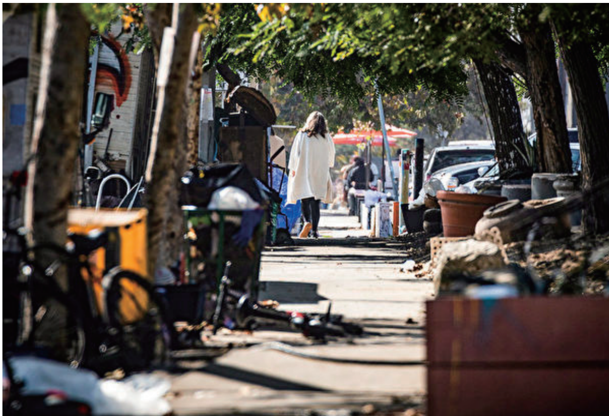
2021年11月10日，在加州威尼士，一名婦女走在人行道上，經過一個無家可歸者營地。

“這種日益惡化的公共衛生緊急情況需要立即採取行動，以挽救生命”卡特去年表示。“洛市