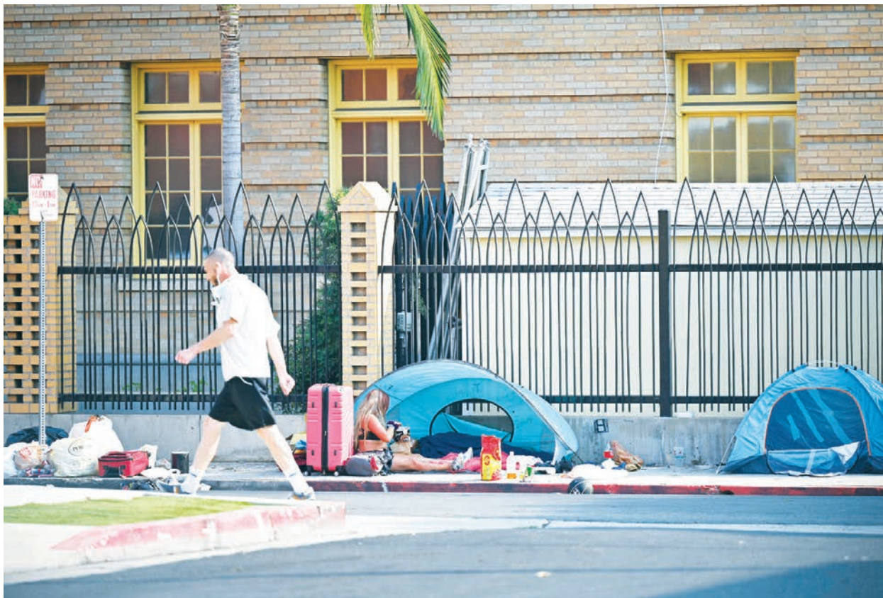
2021年9月24日，加州洛杉磯好萊塢街頭的無家可歸者。

的事情歸咎於大瘟疫，而是這個城市 and 加州政府的規定，他說這些規定使起訴罪犯變得更加困難，而地方政府也一直未能解決無家可歸者的問題。