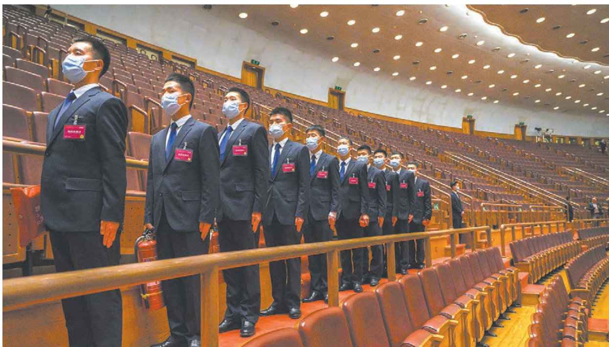
為確保能長期執政，習近平可能會再通過反腐消滅對手。圖為中共兩會現場的保安。

中澤克二認為，習近平要想確保更長任期，甚至終身在任，就需要確立比肩毛澤東的地位，雖然中共十九屆六中全會通過了