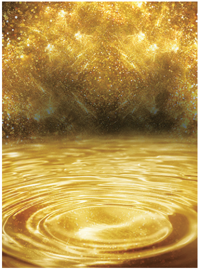
▲ 研究人員猜測，黑洞周圍的吸積盤，是產生重元素的關鍵。