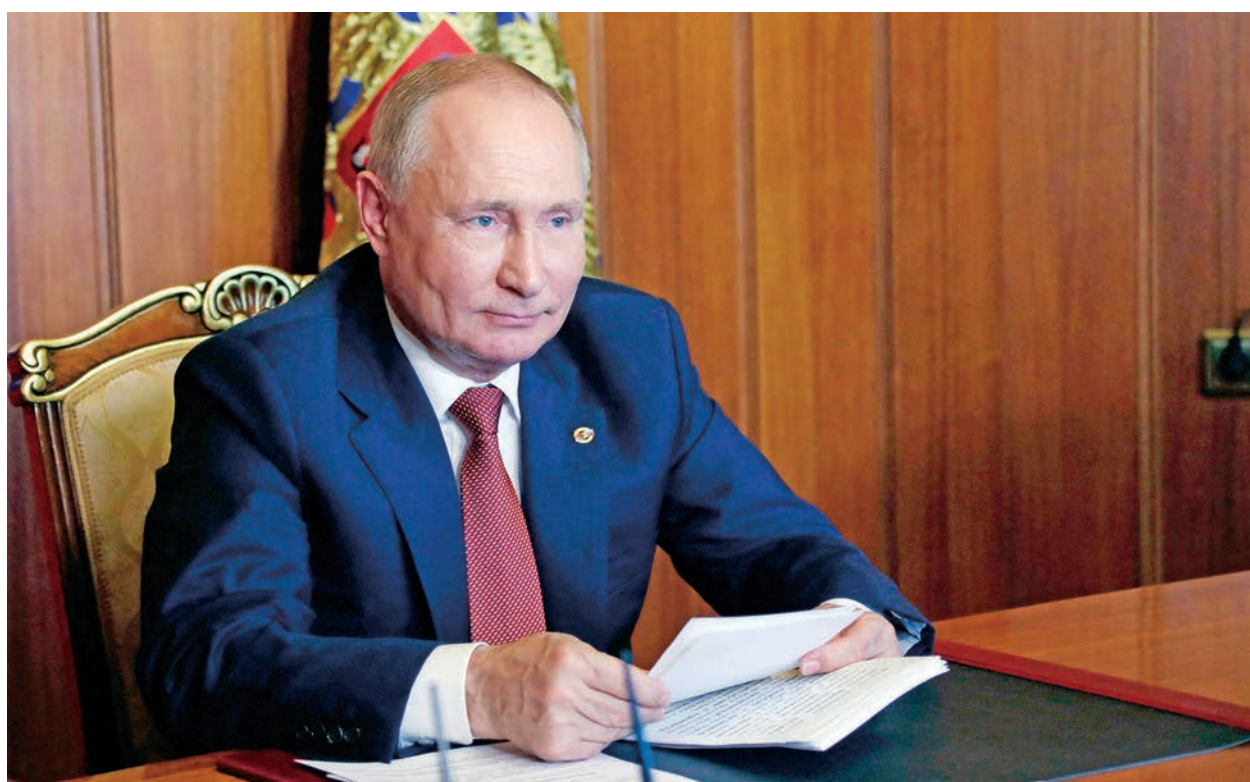
俄羅斯總統普京