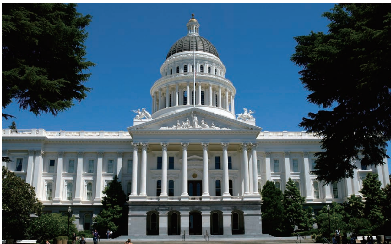
2020年8月28日的加州州立大學富勒頓分校 (CSUF)。

“SAT 和 ACT 考試問題長期以來一直困擾著學生和家庭”，該校理事、長期從事公立學校和非營利機構的教育工作者迭戈·阿