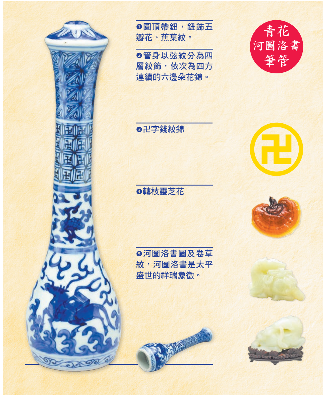
黃帝、帝堯、帝舜、大禹插畫：思又/正見網；五老朝元、筆管、龍馬：臺北故宮博物院；卍字符、靈芝、背景：ADOBE STOCK

河圖、洛書是太平盛世的祥瑞象徵，這支筆圖繪一隻駝著書卷的大龜和一匹背著圖冊的寶馬，《易》曰：「河出圖，洛出