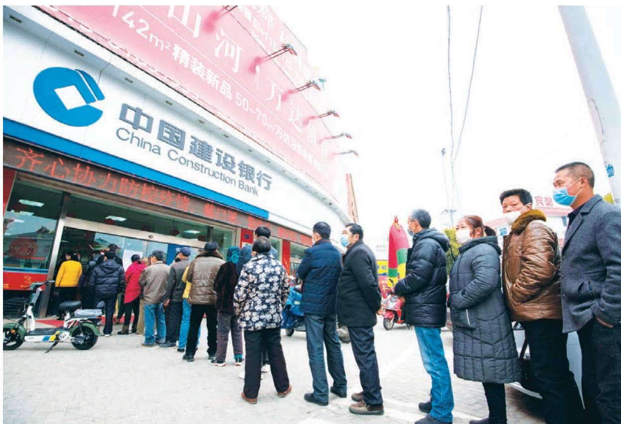
中國人從銀行存取五萬元人民幣現金需要登記。

自然人客戶是一個法律概念，自然人是指在自然條件下誕生的人，自然人與法人都是民事主體。自然人客戶的「身分基本信息」包括客戶的姓名、性別、國籍、職業、住所或者工作單位地址、聯繫方式、身分證件或者身分證明文件的種類、號碼和有效期限。客戶的住所與經常居住地不一致的，登記客戶的經常居住地。