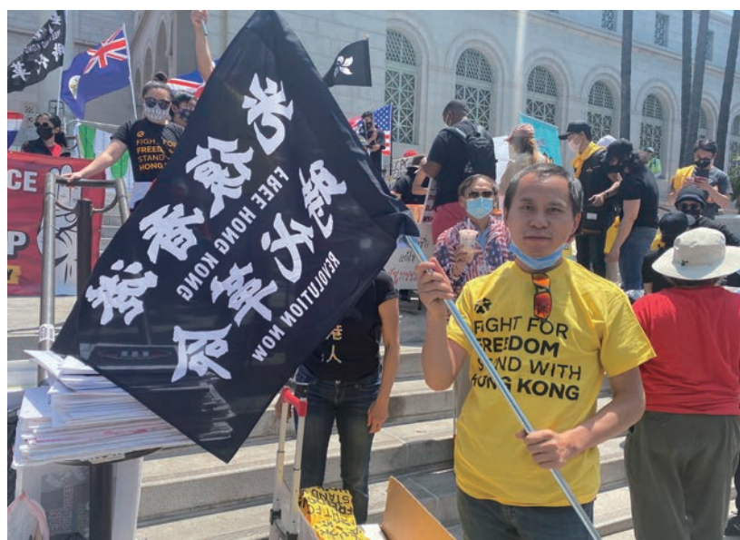
作者舉牌聲援香港

來到美國不久，我時常會看到在遊行示威的人們，他們帶著各種不同的觀念，有的追求種族平等，有的為新型冠狀病毒受害者發聲，也有的在為自己的宗教追求平等。這讓從沒見過這類情況的我感到了驚奇，示威和遊行