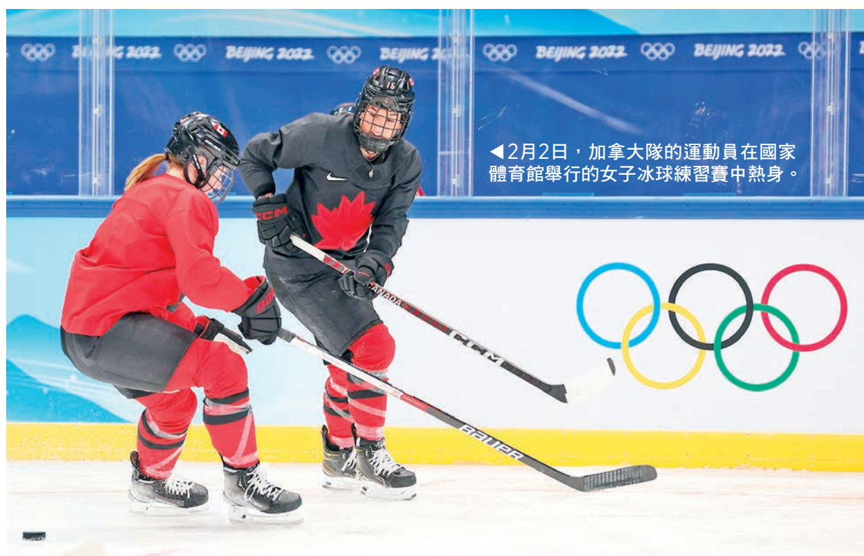
◀2月2日，加拿大隊的運動員在國家體育館舉行的女子冰球練習賽中熱身。

除此之外，主辦方給每一名運動員都準備了禮包，包括價值7999元人民幣（約1255美元）