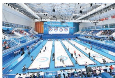
▲位於北京的國家游泳中心