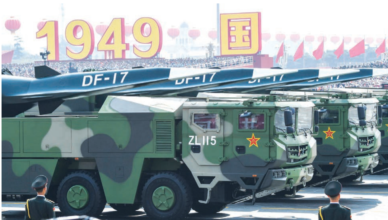
中共於2019年北京閱兵式首次展示的東風-17高超音速彈道飛彈。

不過，雖然他取得顯著成就，卻沒有得到升職與領導的重視，因此心懷不滿。他在去年9月底，向香港英國情報機構取得聯繫。在第一次試探性的接觸中，他告訴中間人，他擁有關於高超音速飛行器（HGV）的詳細信息。他知道，自己一旦被發現將面臨死刑，因此要求為自己和妻子及孩子提供庇護。接著，位於倫敦的軍情六處也接獲消息，