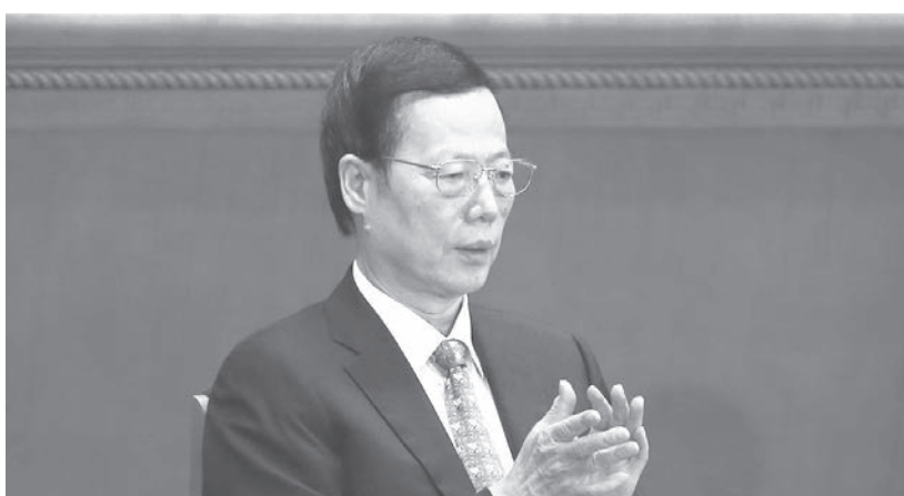
性侵事件後，張高麗的名字首次出現於官方名單。

1月29日，官媒新華社發布有關中共領導層慰問「老同志」的信息，今年這份慰問名單共羅列了111人。排在最前面的是江澤民，接下來是胡錦濤，再下來是16位前中共常委，包括：朱鎔基、溫家寶等人，張高麗排在受慰問名單的第18位。這也是自彭帥事件發生以來，張高麗首次出現在官媒報導中。