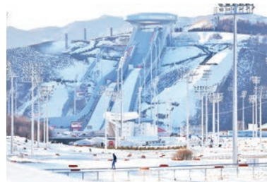
▲位於張家口的國家冬季兩項中心