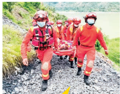
救援人員展開救災行動前,要先做核酸檢測。

調入國家地震局分析預報中心從事地震預報應用研究,現任中國地球物理學會天災預測專業委員會主任、聯合國行政管理與減災全球計畫項目科學顧問等職。