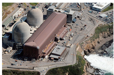
加州Diablo峽谷核電站鳥瞰圖。

PG&E必須在9月6日之前申請該筆聯邦資金。SB846法案文本寫道，如果未獲聯邦政府批准，運營商PG&E將歸還所有未使用和未定用途的貸款，該部門應立即終止貸款。