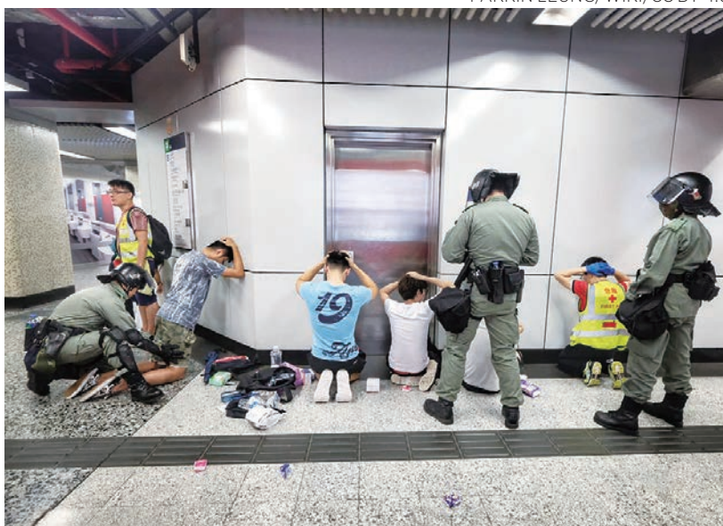
▲2020年8月31日油麻地站，防暴警察在要求急救員和站內乘客跪地面壁。

正是因為這種在英式行政管理下的文明及合理，香港皇家警察這一隊，曾經一度貪腐嚴重的有排爛仔，逐步發展演變成為「亞