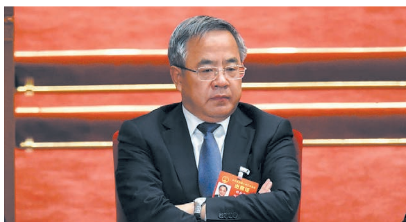
2019年3月，出席中共兩會的胡春華。

8月26日，中紀委網站發布一則消息，山西政協原主席他嚴重違紀違法受到撤銷黨內職務、政務撤職處分。中紀委發文指，