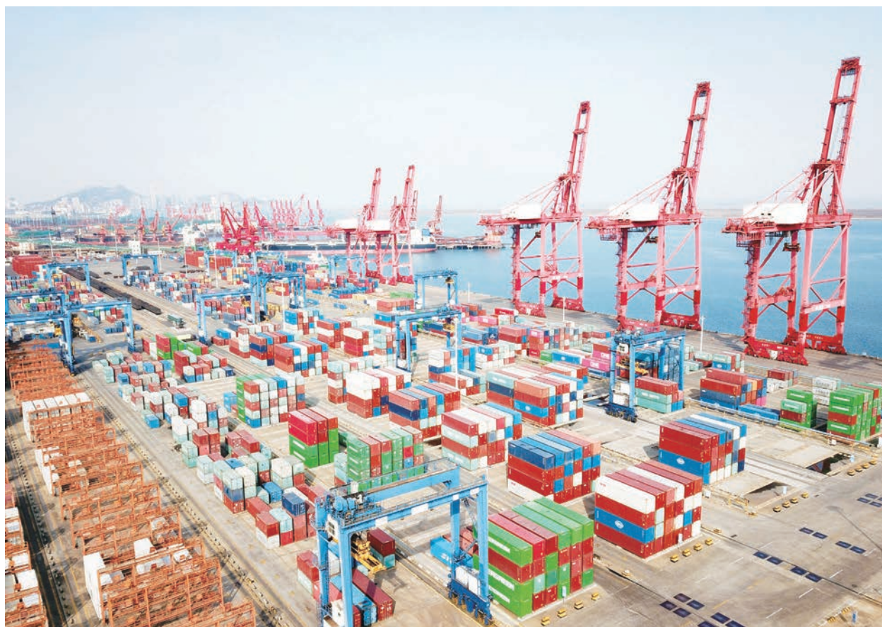
外貿出口是中國經濟唯一的優勢，但似乎只能靠人民幣貶值來促進增長。

定性影響消費，中國經濟活動也受到「清零」防疫政策，中國家庭收入減少正在打擊民眾消費，這對中國內需產生影響。