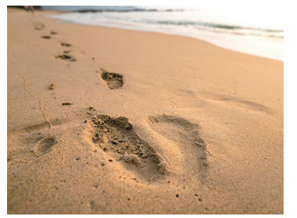
新墨西哥州白沙國家公園發現的人類足跡證實，早期人類大約在2.3萬年前就已定居美洲大陸。厄本說，接下來可能還有更多的發現。