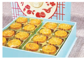
中秋節象徵團圓。(公有領域)

造成不對等的競爭環境。他指出，不少大陸留學生都有背景、有來頭，比如有些是高官子女，國企高管子女，這些特權階層的下一代一旦留港發展，很可能形成新特權階層，對本地香港學生來說，會形成一個不對等的競爭環境，「這對近年已經備受打壓的年輕一代，將會帶來更艱難的向上流機會。」