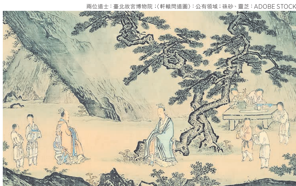
兩位道士：臺北故宮博物院，《軒轅問道圖》；公有領域；硃砂、靈芝：ADOBE STOCK

帝堯問赤將子輿：「黃帝的兩個臣子，都是修仙得道之人，都把自己的修煉方法教給了黃帝，然而都是甚麼方法呢？」