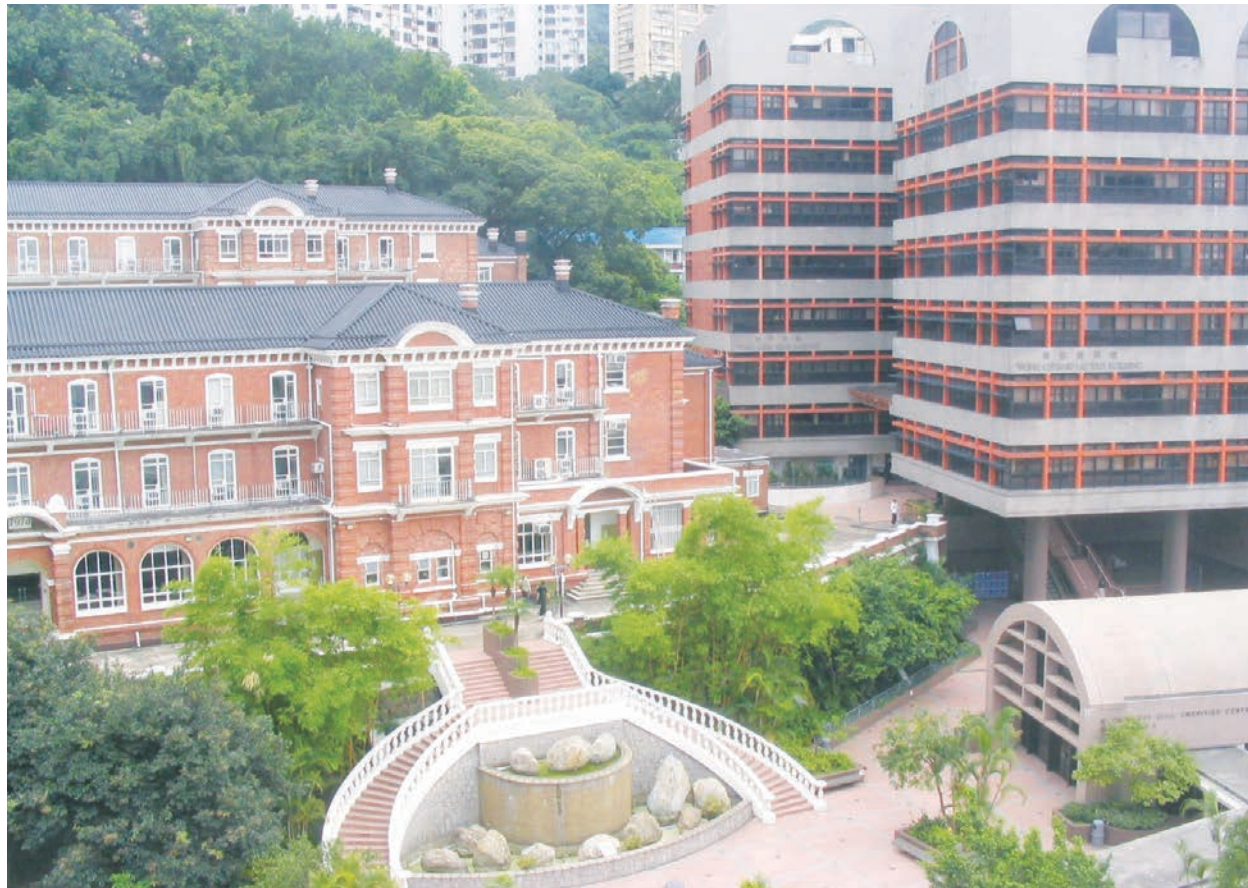
香港大學

根據大陸教培機構「新東方」《2022年中國留學白皮書》，大陸學生選擇來香港的升學比例，由2020年的8%急升至2022年的19%，僅次於英國和美國。因為香港高校仍使用英式教育體系，成為很多中國留學生的首選。