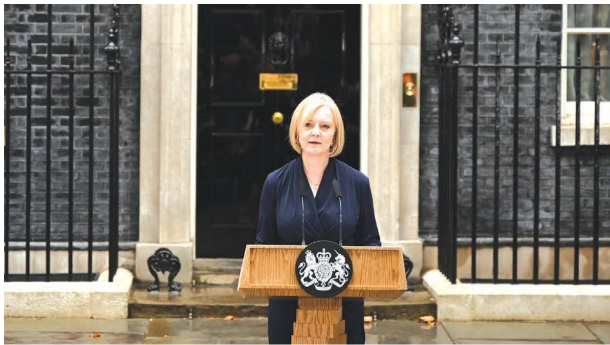
英國新任首相特拉斯，於6日在唐寧街10號官邸前首次以英相身分發表演講。

取果斷措施以解決英國的經濟問題。她強調，她的做法將是兩路並進，一方面立即解決人民生活成本危機，另一方面提出計畫促進經濟增長。