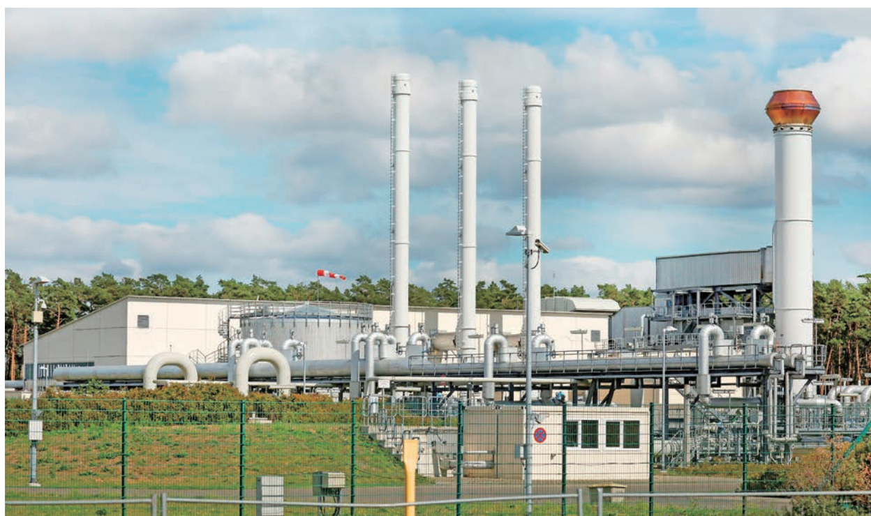
歐洲天然氣價格因北溪1號並未如期恢復供氣急升逾30%，歐洲能源危機不斷升級。

策報告，在該報告中歐盟委員會提出的措施，包括有降低電力需求以及對可再生能源、核能和煤炭實施價格上限。捷克還將建議評估歐盟如何利用碳市場來解決高電價問題，並確保快速就委員會今年早些時候的提議達成協議。