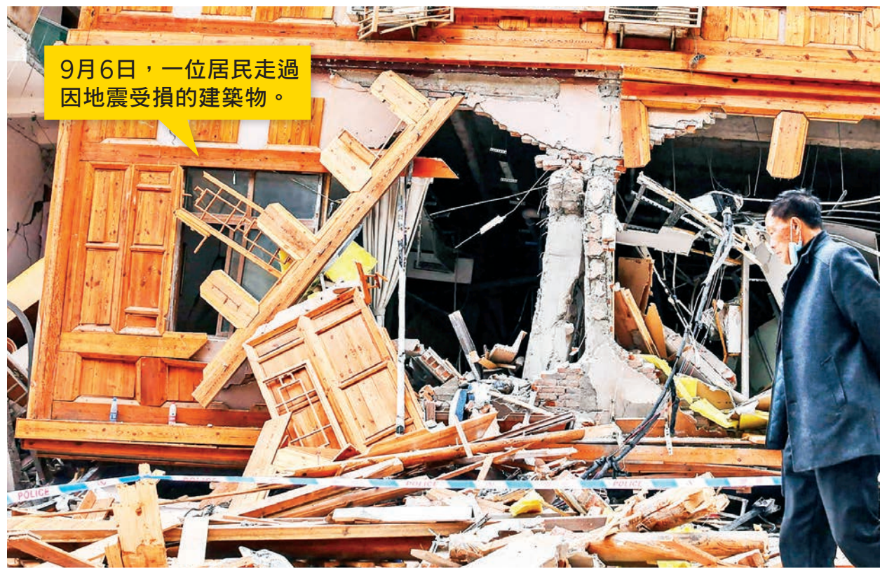
9月6日,一位居民走過因地震受損的建築物。