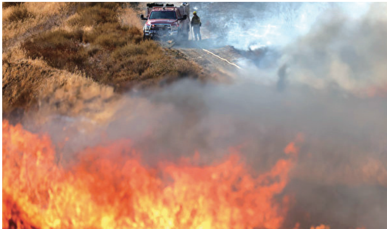
2022年8月31日，一名消防員正在加州卡斯塔克（Castaic）附近燃燒的公路大火（Route Fire）現場進行滅火工作。