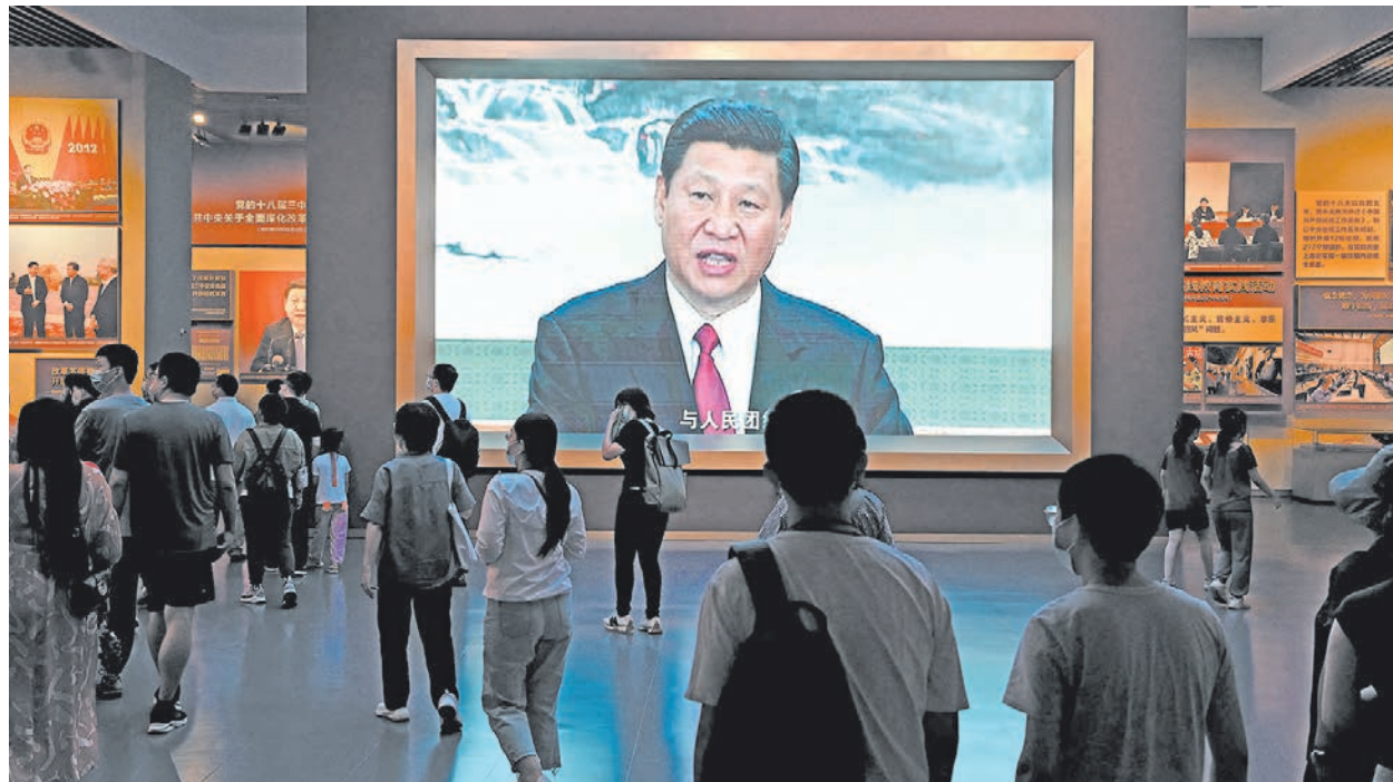
2022年9月4日，人們走過北京中共博物館內展示習近平的屏幕。

此前，8月25日，中宣部副部長、中央廣播電視總臺黨組書記、臺長兼總編輯慎海雄，在與該臺新提拔的官員談話時要求，「始終把忠誠核心、擁戴核心、維護核心、捍衛核心作為最大的政治」。法廣9月5日發評論文章表示，按照中共慣例，沒有最高層首肯，官媒新華社輕易不會發出帶有指導全黨性質的「三不指