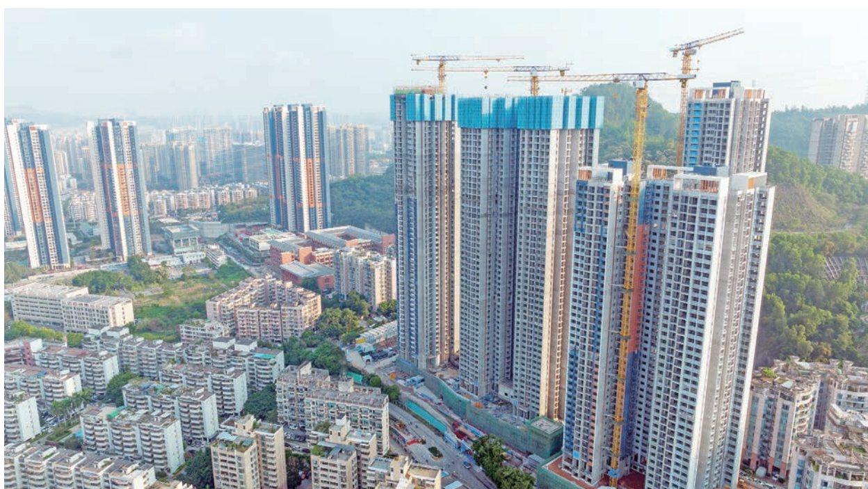
樓市斷供風險正在向金融系統蔓延，也成為中共20大的政治風險。

充分重視問題的嚴重性，即金融風險突增會導致壞帳增多。澳大利亞的澳新銀行估計，爛尾樓涉及的房貸規模高達1.5萬億元人民幣。