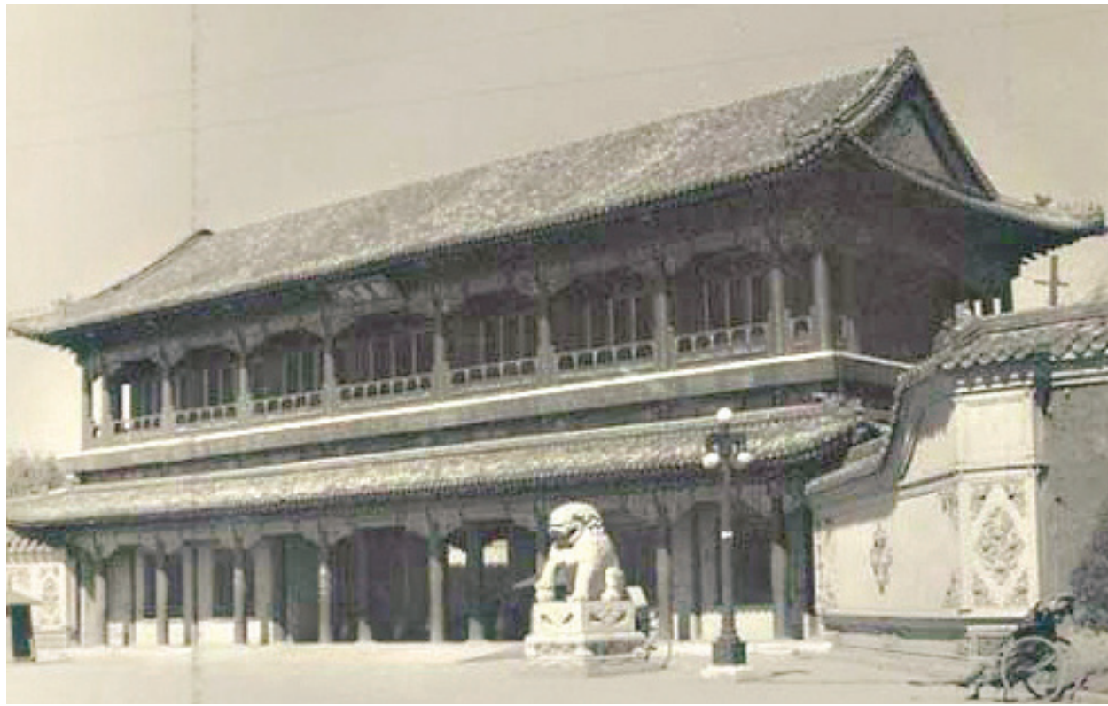
▲中南海新華門(曹錕時的大總統府)