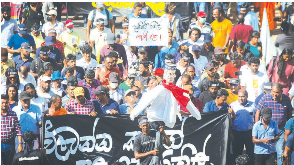
被視為貪腐共犯的代理總統威克瑞米辛赫名字出現在總統候選名單，再度引發大規模抗議。

南亞島國的斯里蘭卡正陷入了嚴重金融危機，據信有部分原因在於斯國加入了中共的「一帶一路」倡議，而向北京政府借貸