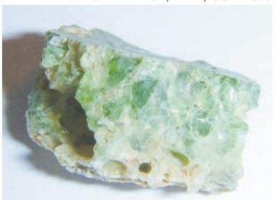
▲被高溫融化後形成的玻璃石。