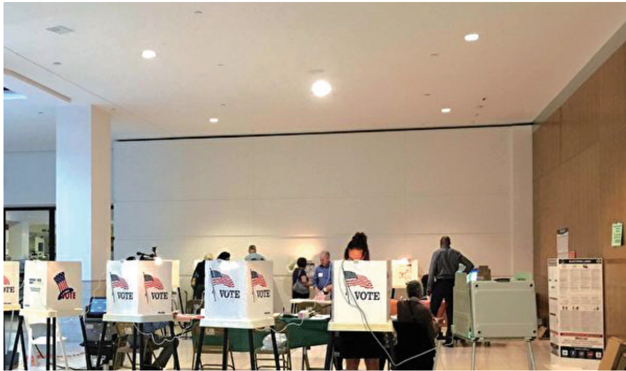
2020年加州的一處投票點。

支持方：加州遊民解決方案 (Californians for Solutions to Homelessness) 和心理健康支持 (Mental Health Support) 組織。