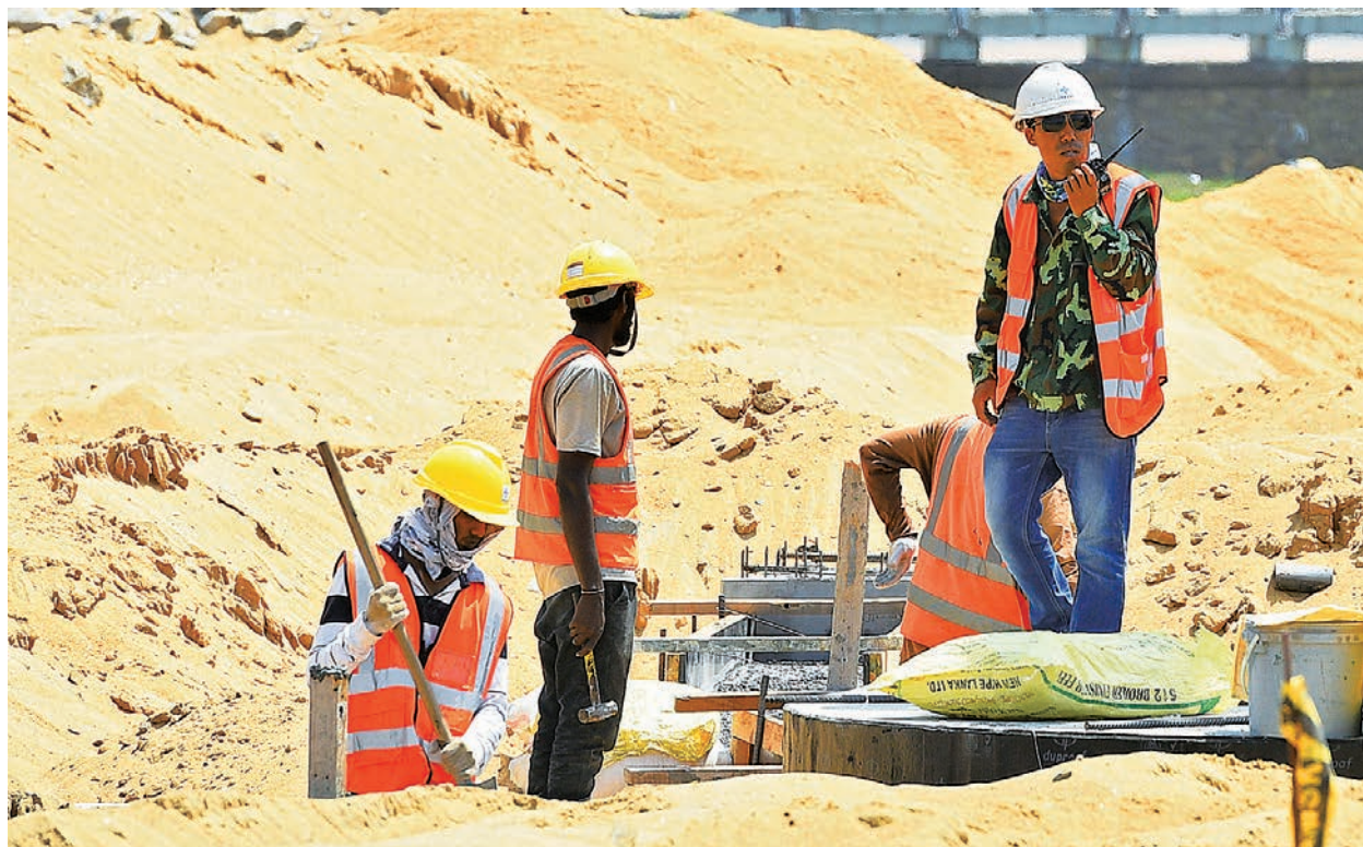
▲2020年2月24日，在斯里蘭卡科倫坡港口建築工地的中國和斯里蘭卡工人。

所以美國和歐洲在最近的七國的峰會上，推出了一個6000億美元的計畫，這個顯然就是針對中共的一帶一路，幫助、扶持這些發展中國家進行一些基建等建