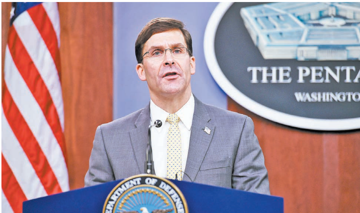
前美國國防部長艾斯培率團18日至21日訪臺。

張惇涵說明，此次訪團中，艾斯培及博貝利皆曾造訪臺灣，艾斯培擔任美國國防長任內，多次公開表達對民主臺灣的支持，卸任後也持續高度關注臺海及區域的和平穩定，是臺灣重要國際友人。總統府期盼透過此行交流，深化美國及歐洲對臺灣的支持、深化國際民主夥伴的合作，