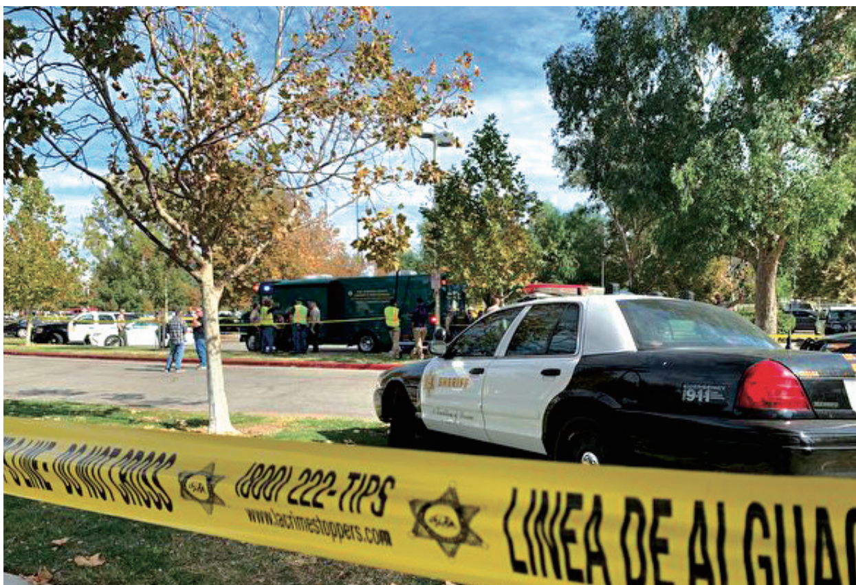
洛杉磯警車資料照。

兩名嫌犯搶走一名購物男子的勞力士手錶，並用手槍毆打了受害者。根據警署辦公室的說法，這塊勞力士手錶價值約6萬美元。