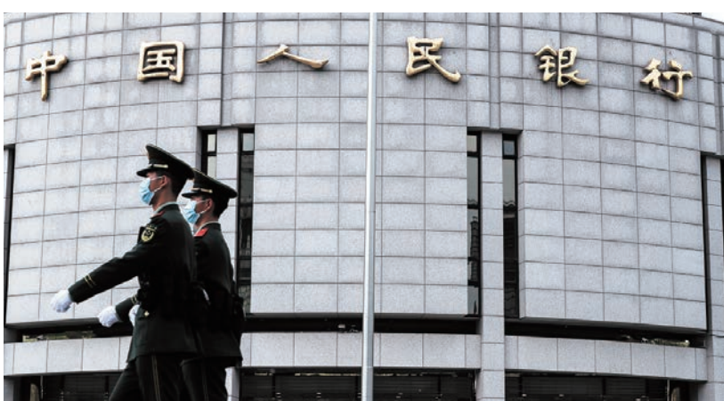
今年以來，已有幾十名金融系統官員落馬。