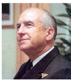
▲時任美國海軍作戰部長、美國海軍上將摩爾。