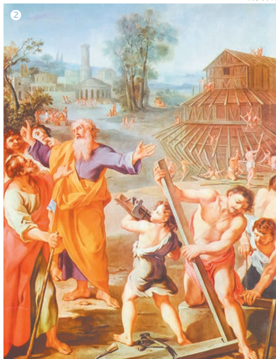
●當諾亞獻上祭品後，上帝在天空顯現一道彩虹，預示著洪水的停止。●諾亞方舟的建造。●大洪水中的諾亞方舟。●大洪水的淒慘情景。

這個天然核反應爐在核廢料處置和基礎物理研究方面，給現代科學家們提供了全新的思路。自從現代核能發電問世以來，核污染與安全一直都是無法解決的難題。而 20 億年前的天然核反應爐卻完美的解決了這些難題，它利用磷酸鋁礦俘獲和儲存核廢料達 20 億年之久，沒有留下任何的安全隱患，關於這個技術，現代科學家至今都研究不明白。20 億年前到底是誰創造了這些高度先進、布局完美的核反應爐？難道遠古時期，人類就掌握了先進的核能技術？