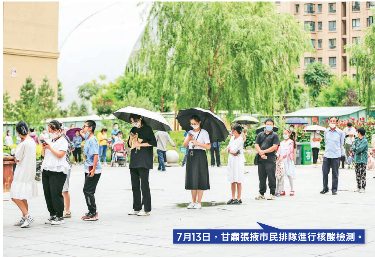
7月13日,甘肅張掖市民排隊進行核酸檢測。