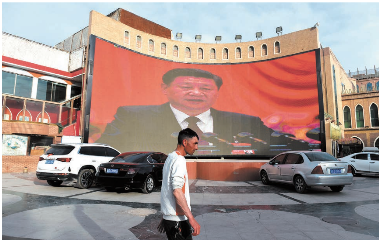
2019年6月4日，新疆喀什一廣場上設立著顯示習近平照片的巨大屏幕。

處周永康、薄熙來、孫政才、令計劃等嚴重違紀違法案件，堅決查辦孫力軍、鄧恢林、龔道安、王立科、劉新雲、傅政華等人的政治團伙案」，「防止黨內形成利益集團，斬斷權力與資本勾連的紐帶」。