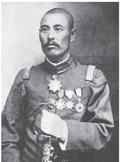
▲北洋第一號軍閥吳佩孚