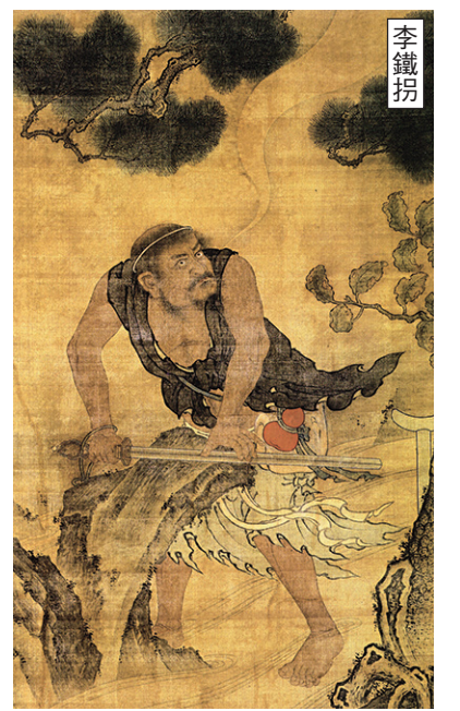
▲礪劍圖，明代黃濟繪。