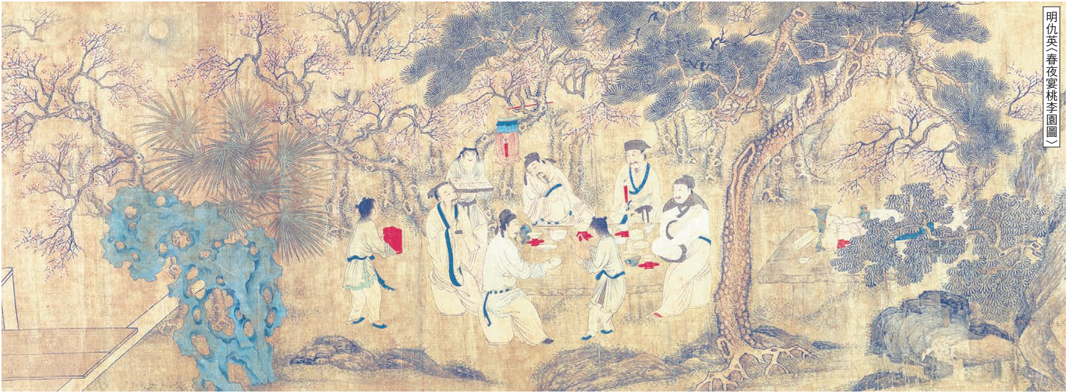
明仇英春夜宴桃李園圖