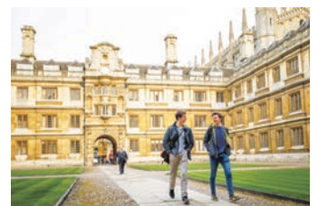
英國劍橋大學

動不動封城、強制全民進行核酸檢測等。去年6月，中共衛健委有公文規定，官方實施的全民核酸檢測(PCR)由醫保負擔，造成醫保嚴重透支，經濟重創。因此不得不延長繳納醫保費的時間，以作為彌補。中國社會福利問題研究者認為，面對中共的疫情清零政策，如不採取相應措施，醫保結餘最多維持3年。