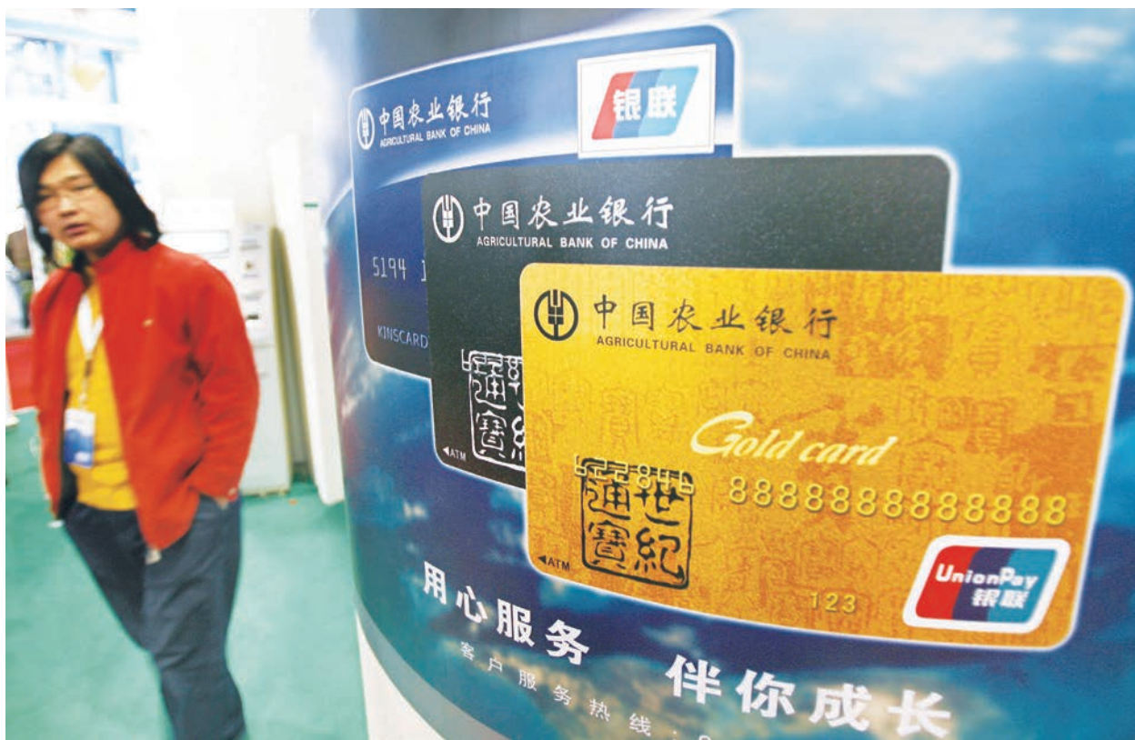
中國各地銀行「斷卡」行動正在不斷升級。(Getty Images)

按照網友的總結，「斷卡」行動就是：凌晨交易封，一天多次交易封，一進一出交易封，3個月不