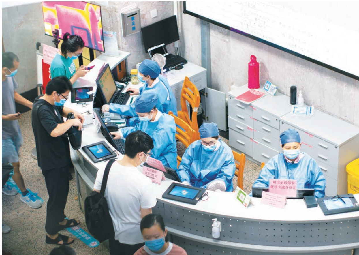
中國多地醫保出現收不抵支。

新華網報導，中國多省近期相繼上調省內醫保最低繳費年限標準。6月22日，由廣東省稅務局等多部門聯合制定的「基本醫療保險關係省內轉移接續暫行辦法」指出，到2030年1月1日，全省累計繳費年限將統一為男職員30年，女職員25年。其中未達規定的地市，從2022年要開始逐年均衡調整。對於相關消息，中國民間普遍認為是政府醫保基金存款不足，因此讓百姓來負擔。一名武漢市民對自由亞洲電臺表示，「以前繳納醫保是15年限期，就可以享受終身醫保了，無論男女都繳15