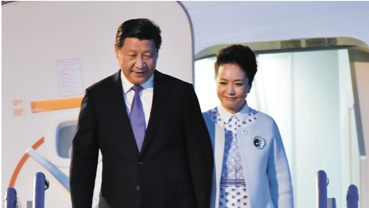
習近平和他的夫人彭麗媛。(Getty Image)

香港《蘋果日報》援引分析人士何頻表示，此案對習近平政權的意義絕不亞於薄熙來案、令計劃案和周永康案等。他指，孫力軍掌控公安部一局（國內保衛局）期間，親自操辦了如肖建華案、