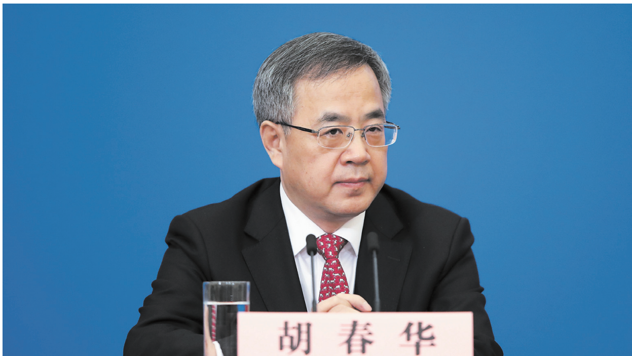
政治局委員、國務院副總理胡春華是「接班人」的熱門人選。