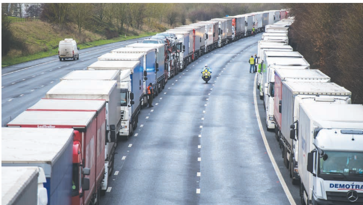
法國對英下達交通運輸48小時禁令，導致英國千餘部貨車回堵在通往法國的海地隧道入口。

足夠促使英國政府把警報等級提升至第4級，而無法等到實驗室結果出爐後再採取行動。英相約翰遜在19日的記者招待會上說，到目前為止，沒有證據表明疫苗對這種新病毒株的有效性會降低，但他補充說：「還有很多我們不知道的。」