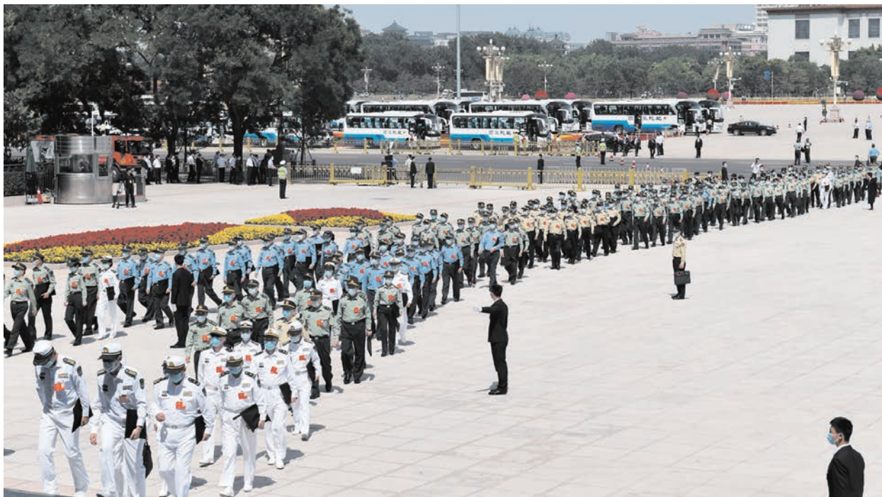
今年兩會上，軍方代表們戴著口罩進入會場。

【看中國記者李文隆綜合報導】中共軍方將領近期晉升動態頗多，日前習近平親自晉升4名上將。習近平上臺至今從2012年底至今已升51名上將。但當中被指不一定是習近平的人，有些曾傳出被查。