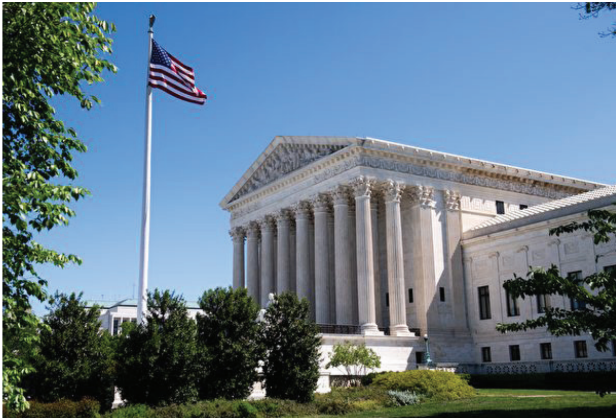
美國最高法院。

洛縣最近感染出現激增，截至目前總感染人數已超過了62萬例，住院人數也持續飆升。目前洛縣的