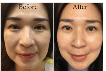
皮膚光滑了，法令紋、眼袋消失了

荷爾蒙失調、內分泌紊亂、改善前列腺、甲狀腺、經期失調、更年期婦女、痛症炎症、皮膚過敏、皺紋、暗瘡、老人斑、雀斑、眼袋、皮膚鬆弛及各類皮膚病等均有顯著效果。