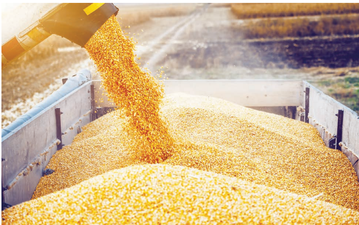
中共中央經濟工作會議中，「安全」一詞使用量比去年會議增加十倍。(Adobe Stock)

「安全」一詞在本次中共中央經濟工作會議是高頻詞彙，從2019年底的中共中央經濟工作會