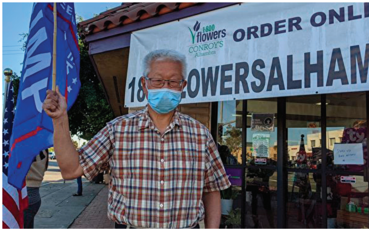
移民美國近五十年的許先生呼籲華裔連署參與罷免紐森。

因為2014年加州選舉通過47號公投提案，不超過950元的竊盜屬於輕罪，所以許多罪犯行竊、砸車，因為受害人損失不足950美元，警方難以檢控，苦主只能自認