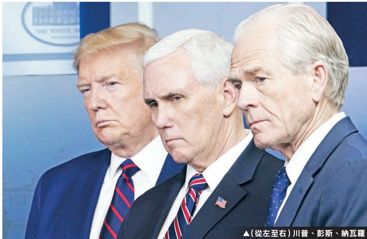
▲(從左至右) 川普、彭斯、納瓦羅