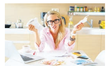
看著帳單發愁的女子示意圖。

在家人的支持下，帕特決定完成大學學業。獲人類學學士學位後，帕特還要攻讀歷史學學士學位，並打算在2023年完成。帕特說，學無止境。