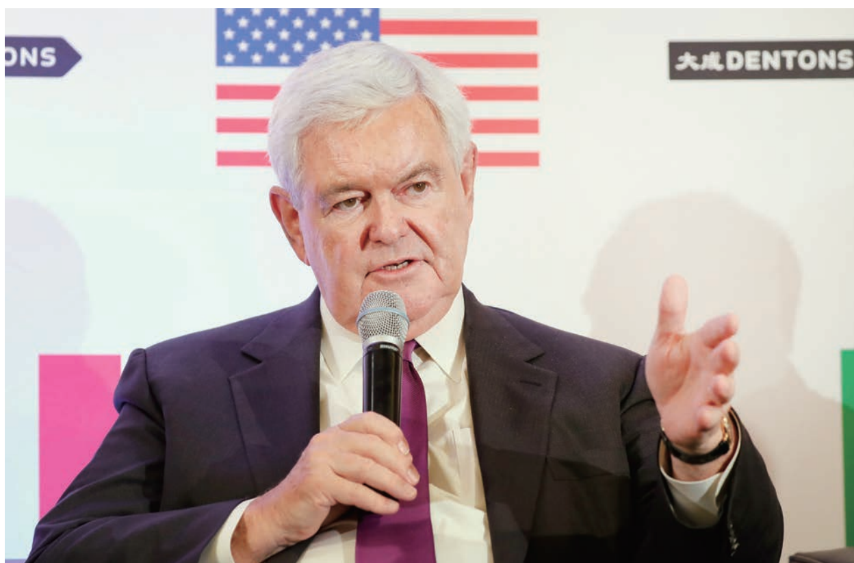
美國前眾議院議長金里奇