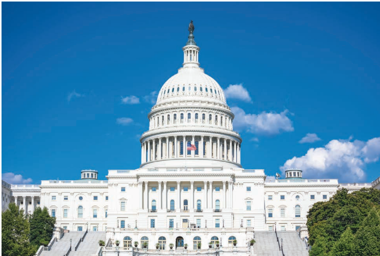
美國國會大廈

19位議員要求舉行聽證會的理由是，法律系統包括最高法院不作爲，而國會是最終的仲裁機構。信函指出了本次美國總統大選的大量舞弊行爲和美國法院系統的失職，以及在這種情況下，國會應如何應對。信函說，「（本次）總統選舉一直是數十起訴訟的主題，這