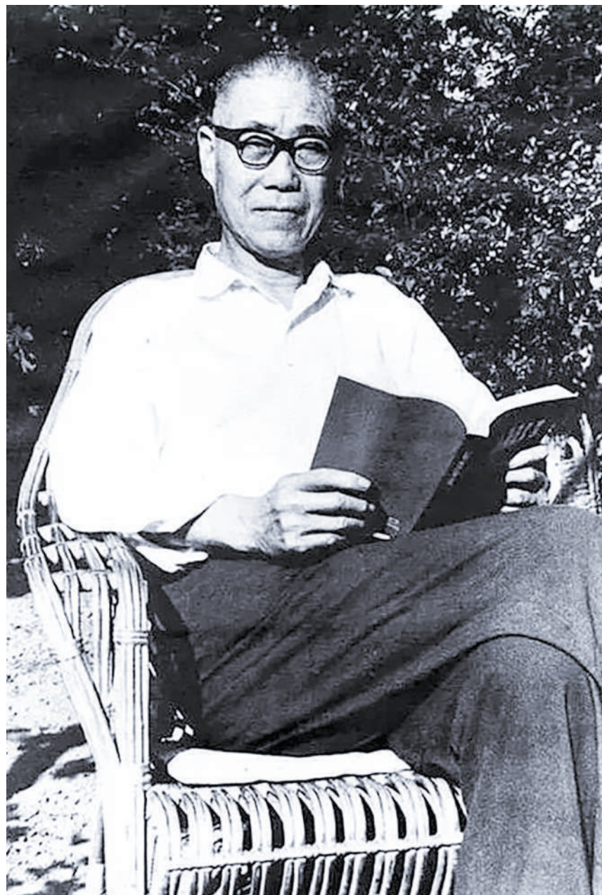
杭州潘天壽舊居，起居室兼畫室。

潘天壽善於以書畫之法入印，另具一格。他的篆刻，有書法中凝重着勁的筆調，有繪畫中奇崛壯闊。最能代表他治印造詣的，是那方他常用的白文——「潘天壽印」，這是正宗的漢印風格，運刀全用中鋒，剛中有柔，巧中藏拙，拙中藏巧，以挺細取勝。潘天壽追求畫面的「明豁」，因而他特別注意了畫中空白的運