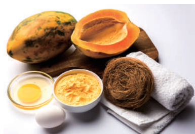
木瓜面膜去角質，讓肌膚煥然一新。

作法： 將黃瓜切片直接敷在臉上，或是將黃瓜打成泥狀塗抹於臉上，等15至20分鐘用溫水洗淨後，肌膚會變得清爽舒服。