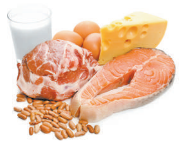
▲多攝取奶、蛋、魚、肉類等高蛋白食物，有助於預防壓傷。