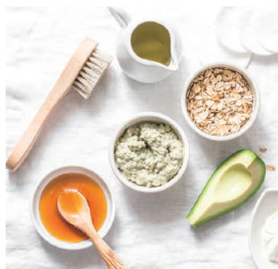
酪梨面膜為肌膚深層保濕。