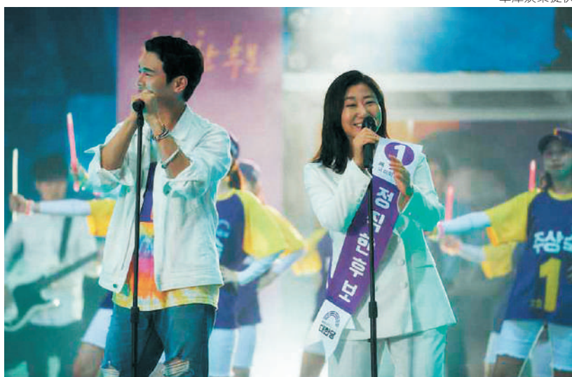
《正直的候選人》電影劇照

不能說謊後，隨之而來的是一連串的誠實告知和有問必答，包括：關於資金往來和私生子的逃兵，甚至希望投票的人民越笨