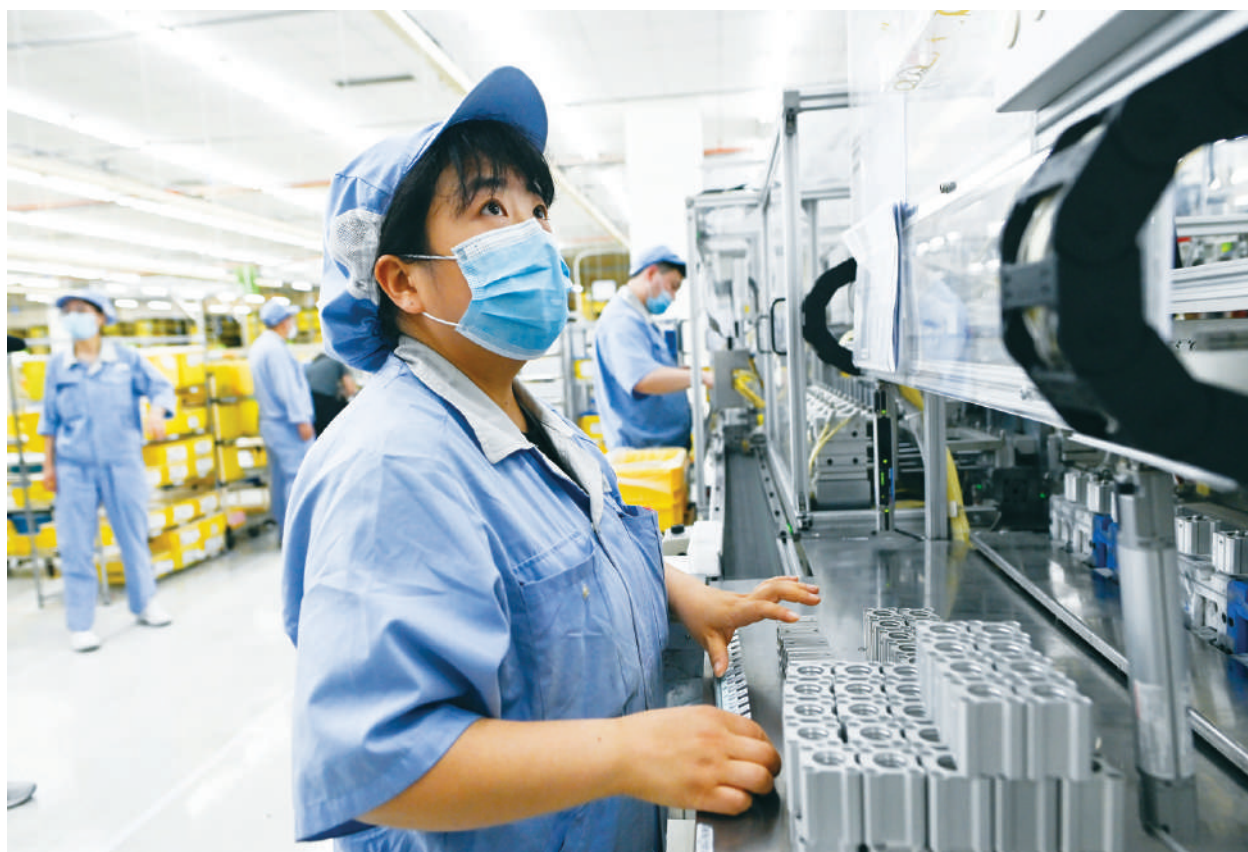
在疫情的影響下，GDP增速預估降至1.7%。

間，當前中小企業發展仍面臨複雜嚴峻的局面。穩步推動批發零售、住宿餐飲、文化、教育、醫療、養老、旅遊等服務業需求的正常化。「努力滿足中小企業資金需求。要加快中小銀行充實資本金，加大股權、債券市場對中小企業發展的支持」；「考慮疫情導致的某些經濟停擺和企業『休克』情況，制定務實管用的階段性政策，支持各類中小企業尤其是暫時處於困難狀態、發展前景較好的中小企業順利渡過難關。」