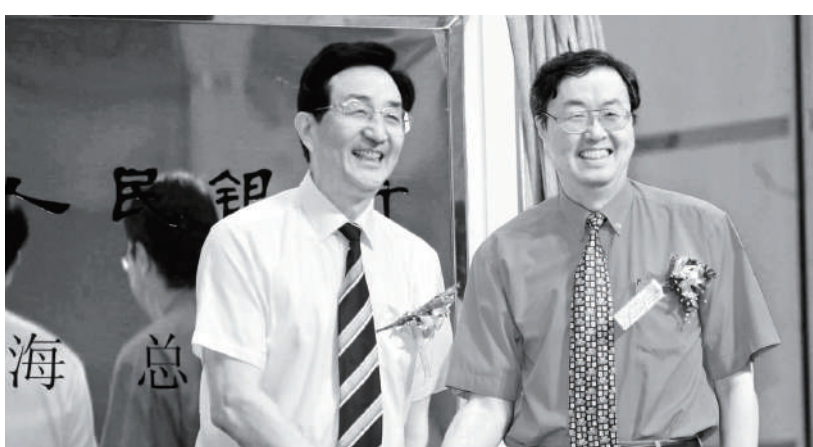
2005年的陳良宇（左）與央行行長周小川（右）。

2006年7月，涉案金額超百億人民幣的「上海社保案」浮出水面。案發後，有包括陳良宇、寶山區區長秦裕、上海社保局