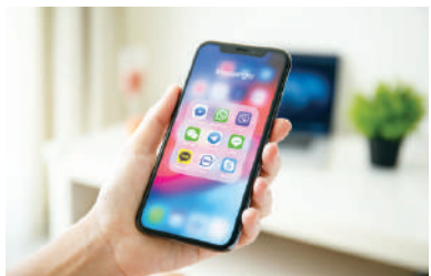
微信不僅監控中國用戶，也監控國外用戶。

【看中國記者黎小葵綜合報導】微信（WeChat）近年已成為中國人手機內必備的通信軟件，使用者聊天的一字一句，統統受到北京網管的監控，也因此，官方敏感內容均無法傳送。然而，日前再爆出，當局通過微信監控的不僅是中國地區用戶，審查已擴展至全球。