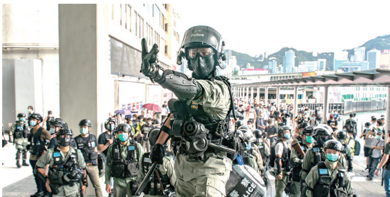
5月10日母親節，港警在旺角大舉拘捕市民。

交界，多名沒有委任證的便衣警察將市民制服在地。10時許，西洋菜南街有雜物起火，大批防暴警察多次向記者及在場人士施放胡椒噴劑，有記者跌倒，情況十分混亂。