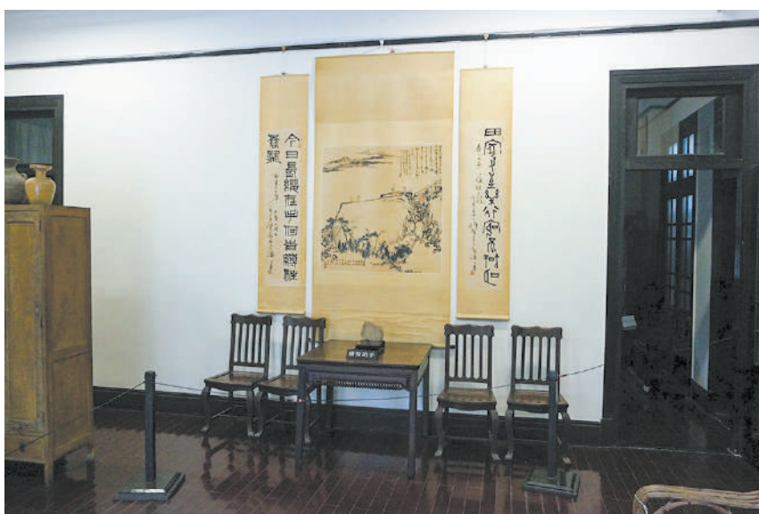
五瑞圖；故居；潘天壽