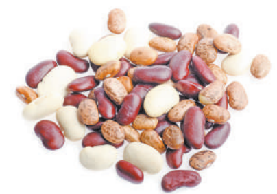
▲豆類是含凝集素最多的食物之一。