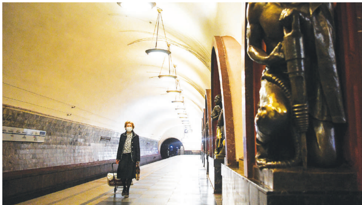
昔日摩肩擦踵的莫斯科地鐵，在疫情飆升下一片死寂。

俄國於疫情爆發之初對防疫態度十分輕忽，今年初除了援助中國之外，在歐洲疫情爆發之際，俄方持續進行援外工作，並有多架次專機多次運送防疫物資至意大利，一度讓人認為俄羅斯的疫情輕微。普京在3月25日高調貼出自己穿全身黃的隔離衣前往醫院視察的照片，他還大讚僅有中國領導人與他關心病患的情況，可是卻遭普京的親信、莫斯科市長的索比亞寧（Sergei Sob-