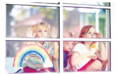
在疫情下，只能待在家裡的孩子們。

謝爾比用12個透明塑料袋做了一個塑料屏障，固定在自家門上，然後按照孩子們的身高，在塑料屏障上開了兩個可以把手臂伸進