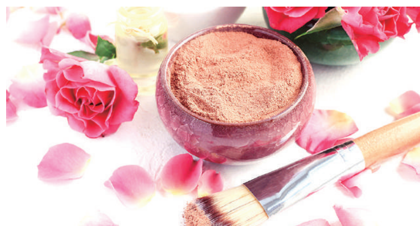
玫瑰面膜能活血散滯，改善肌膚色素暗沉。

作法： 將1茶匙的玫瑰水、1滴玫瑰精油，及1湯匙的希臘優格混合攪拌均勻，即可完成。