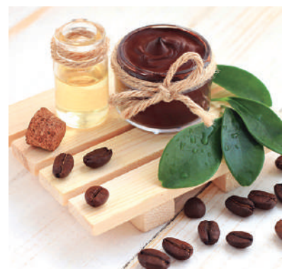
可可粉中含有可可多酚及類黃酮。

大家在抗疫情期間除了在家讀書、靜坐或是種植果蔬菜卉外，也可以試試手作面膜，不僅可以節省荷包，也能避免使用到有含有防腐劑的市售面膜，可謂是一舉數得。所有材料皆來自於天然的食物，只要在廚房把它們混合搗好，就可以使用。既方便又能達到美白效果，讓自己在居家禁足期間也能保持亮麗，何樂而不為？下面教大家幾種面膜製作的方法。