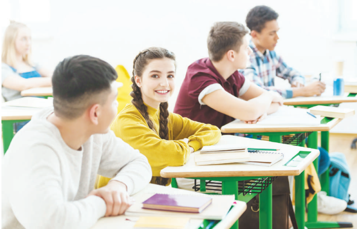
北大、清華、交大等大陸名校，取消外籍生考試。

也有學生家長直言：「北大對國外學生免試，這對中國孩子非常不公平，那些苦讀10年寒窗的孩子會怎麼想？這是一件非常悲哀的事。作為中國名牌大學就應該優先