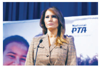
美第一夫人梅拉尼婭

史大軍也指出，北京原打算通過海外孔子學院、一帶一路等方式，向海外輸出紅色意識形態，但受到來自西方國家的壓力，現在採取把外國學生「請進來」的方式，進行洗腦教育。