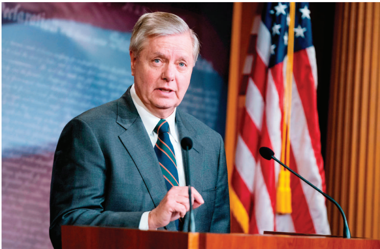
美國國會參議院司法委員會主席、共和黨人林賽·格雷厄姆（Lindsey Graham）

這一被稱為「COVID-19問責法」的法案將要求川普總統向國會作證，北京當局已經與由美國、盟友或聯合國機構牽頭的對病毒的國際調查合作，關閉所有相關的野味市場，並釋放在危機中被捕的香港