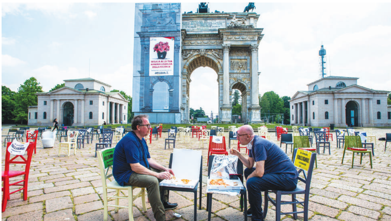
意大利當局允許公園和公共花園從週一（5月4日）開始重新開放。圖為5月6日米蘭聖皮諾公園廣場。

意大利總理朱塞佩·孔戴強調，人們必須保持社會隔離尺度並避免舉行大型集會，才能使該國前進到預計於5月18日開始的重新開放的下一階段。屆時，商店、博物館和圖書館都可以開門營業。到6月1日，酒吧、餐廳就餐區、咖啡館和美容院可以再次重新開放。但是學校仍將關閉到9月分。