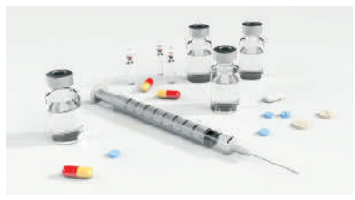
藥物瑞德西韋獲美FDA的緊急使用授權 (示意圖)。

【看中國訊】美國總統川普日前宣布，生物製藥商吉利德醫藥公司 (Gilead) 生產的藥物瑞德西韋 (Remdesivir) 已獲食品藥品監督管理局 (FDA) 的批准，緊急使用於治療中共病毒 (武漢肺炎) 確診患者。