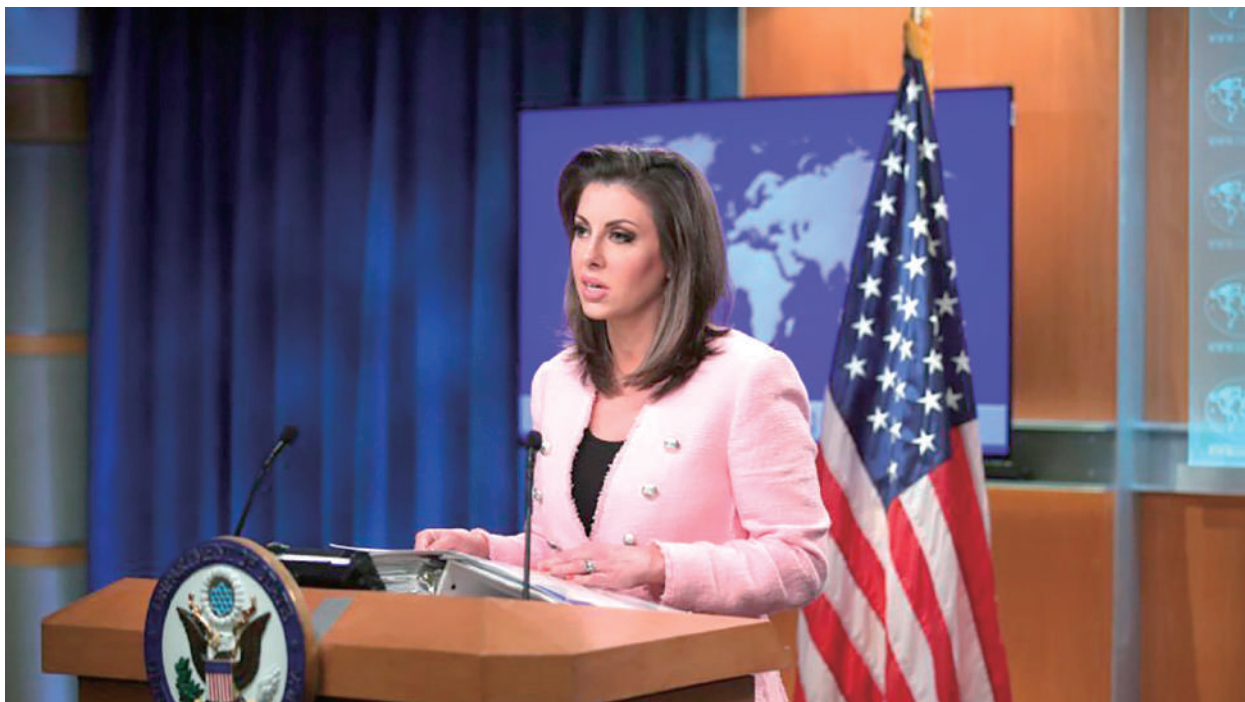
美國國務院發言人歐塔加斯（Morgan Ortagus）

歐塔加斯強調，全世界都能從臺灣身上汲取許多有關中共病毒（又稱武漢病毒、新冠病毒）疫情的教訓，「我們認為全世界都應該