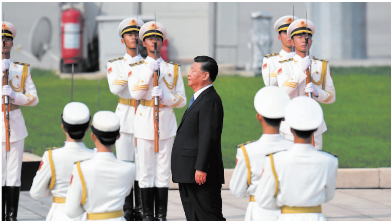
內外壓力之下，習近平加快清洗政法系統內的「餘毒」。

外界傳言是王小洪捉了孫力軍，這一說法有跡可尋。去年5月忽然成立特勤局這個新部門，半年後，今年2月，孫力軍被派往武漢督導「維穩」，其實就是被「調虎離山」，4月19日，孫力軍落馬；在孫力軍被查第二天，特勤局開黨務電話會議，王小洪