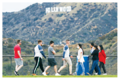
好萊塢標誌