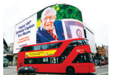
百歲退役軍官摩爾 (Tom Moore) 為英國醫護募得3100多萬英鎊。

英國皇家空軍 (RAF) 兩架二戰時期戰機，包括：噴火戰鬥機 (Spitfire) 與颶風戰鬥機 (Hurricane)，在摩爾生日那天