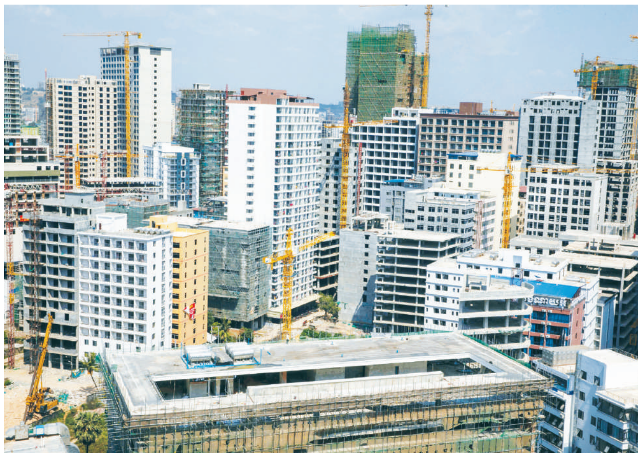
中國家庭平均資產逾300萬？民眾和經濟學家有不同的答案。