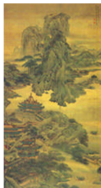
▲項羽火燒阿房宮，就斷了秦朝的龍脈了。