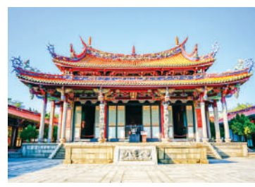
臺灣臺北孔廟

言都非常關心且有興趣。」談到增進臺灣與國際民間交流，歐斯林建議臺灣在海外建立文化學院，即臺版「孔子學院」，可以用「孫逸仙學院」或其它名字。他表示：「反共的臺灣絕對是中華文化更好的例證。」