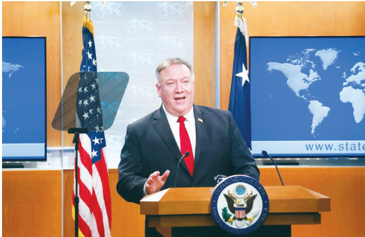
美國國務卿蓬佩奧

蓬佩奧在中國大陸人氣飆升，令中宣部非常緊張，擔心社會輿論導向失控。日前，疑似北京網信部門下令要求檢查和刪除境內力挺蓬佩奧的言論信息，包括蓬佩奧洗碗、做家務的照片，已遭大量刪除。