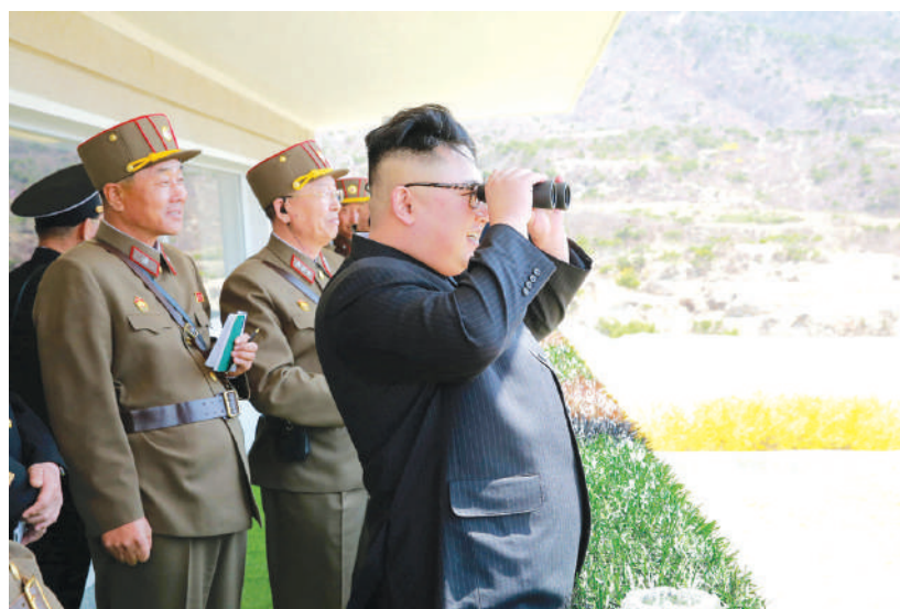
▲金正恩視察軍隊演習，2017年。

3月27日，英國首相約翰遜自己在twitter上宣布感染上了肺炎，住院治療。4月6日，約翰遜病情惡化轉入加護病房，只好請外交大臣多米尼克臨時接替首相主持政府事務。4月9日，