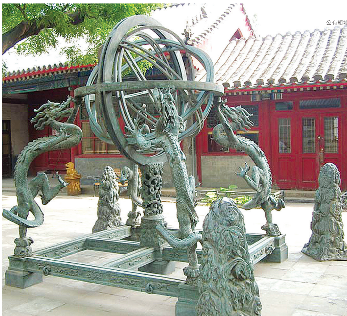
北京古觀象台的渾儀

這一課，大家可能覺得比較接近現代科學的知識了，覺得我們民族的曾有過的可以引以為傲的高科技，終於出現了。其實，古人雖然提到這些科技，但是跟我們今天對科技的認識，存在