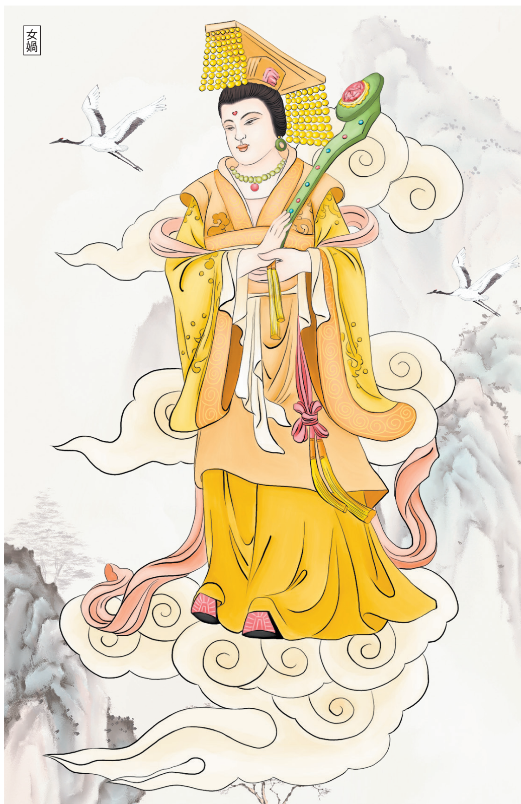
插畫：WINNIE WANG；背景：ADOBE STOCK

另外，高維度時空中的生命雖然可以隨意進入低維度時空之中，但是不能完全進入，只能片面、部分的進入。比如：水面是二維的時空，我們在三維時空中將一隻手垂直放到水面中，當中指最先進入水面時，在水面這個二維時空中所呈現的只是中指的橫截面——如同一個圓的形狀。當兩根手指進入水面後，所呈現的也是兩個圓、兩根手指的橫截面……永遠無法完整的呈現整個手的樣子。當我們向二維時空中的生命講解手的样子時，他們是無法理解的，也不會承認的，因為他們的思想及認知領域中無法建立起這樣的概念，他們缺少一個維度。他們認為三維時空中的手是一個圓或幾個圓。這只能像盲人摸象一樣，認為大象是一根柱子，或是一根繩子……這在他們這個層次和維度中看是對的，因為在這低維度中呈現出的就是這樣，但在更高維度中看，卻是荒唐可笑的。所以猶太人流傳著一句格言：人類一