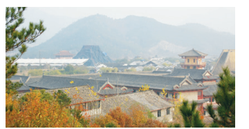
浙江東陽橫店影視城宣布暫停拍攝工作。

市長侯友宜表示，因應「武漢肺炎」疫情，市府已做了高標準的預防準備，「並祈願疫情趕快結束。」他稱，大家「一起點亮，就有希望」。主燈被點燃升空後，近百個祈福天燈同時冉冉升空，畫面壯觀，令現場觀眾連連驚呼讚歎。平溪是臺灣30個經典山城小鎮之一，這次前來造訪遊玩的民眾比往年更多。今年的第2場放天燈活動將在8日元宵節舉行。