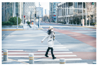
2月3日，北京市中心的街道空蕩蕩的。

再戴上。與人交談時保持約半米距離，若對方咳嗽、打噴嚏且拒戴口罩，需離他約一米遠或離開。在疫情流行時，避免握手或擁抱。