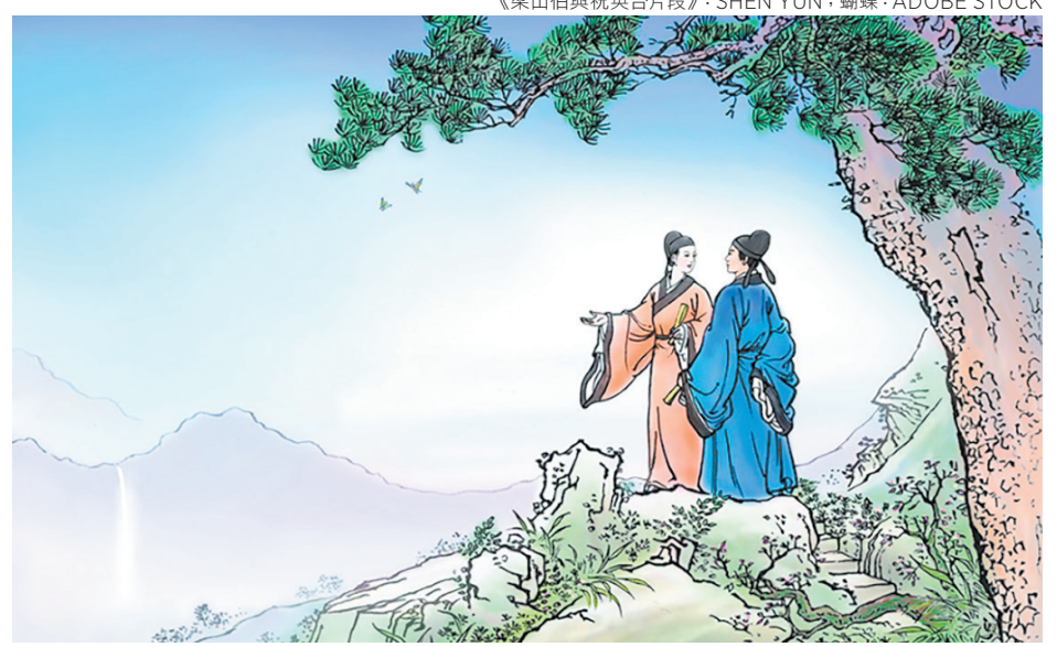
《梁山伯與祝英台片段》：SHEN YUN；蝴蝶：ADOBE STOCK

如今，「神韻」舞臺上的梁、祝結局與以往不同，展現了一段佳偶天成的故事。舞劇俏皮、幽默、美麗，當梁山伯履約而至時，祝英台的父親明白了女兒的心意，成全了這段姻緣。