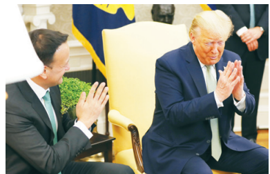
川普總統展示印度合十禮。

衛生當局勸告人們避免握手，以遏止具有高度傳染性的病毒擴散。美國總統川普、愛爾蘭總理瓦拉德卡，以及法國總統馬克龍，最近都使用了印度的問候方式——雙手合十，來歡迎訪客。「Namaste」梵語的意思爲「向你鞠躬致敬」，這個問候方式不會與人皮膚接觸，並且可以在向人問候的時候保持一定距離。日前，馬克龍在巴黎的愛麗舍宮歡迎西班牙國王菲利普夫婦時，他雙手合十，稍微彎身，用這