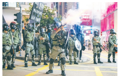
去年香港「反送中」運動期間，警察對示威者濫用暴力。

【看中國記者何佳慧綜合報導】美國國務院最新發表的《2019年度人權報告》的香港部分，聚焦反送中運動期間的警暴問題。