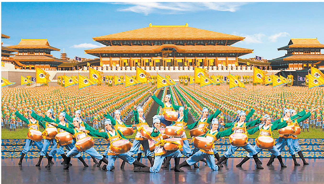
《唐陣》：SHEN YUN；蔣介石：GETTYIMAGES；其他圖片：ADOBE STOCK