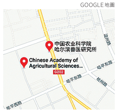
▲Google地圖顯示：哈爾濱獸醫研究所位於731部隊舊址旁邊。