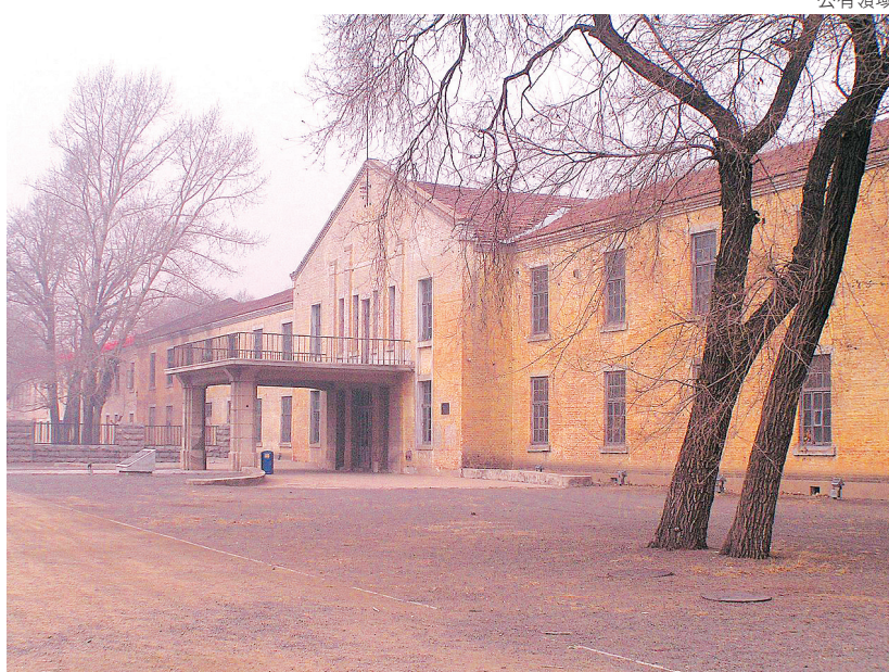
▲「731部隊」位於哈爾濱的營區。