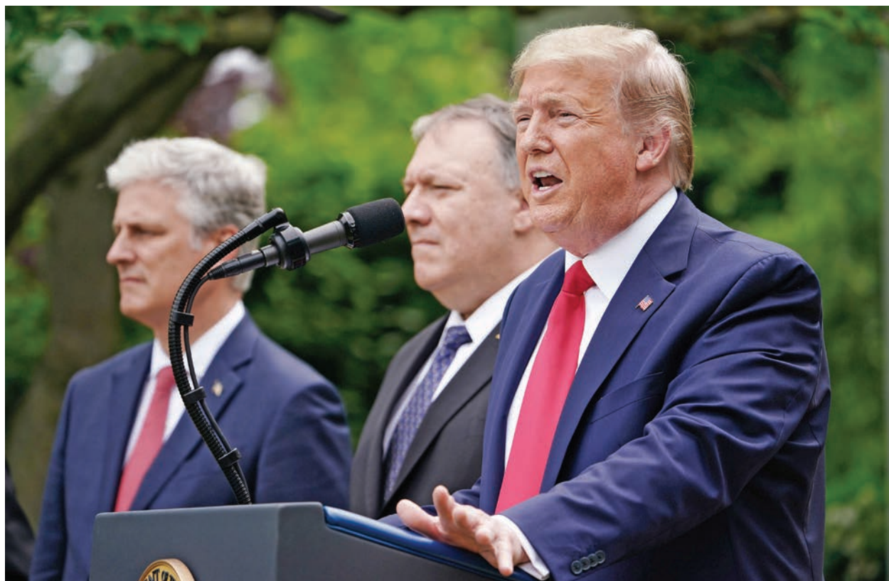
北京強推港版《國安法》，美國總統川普宣布取消香港特殊地位，美國將終止出口國防設備至香港。

果。」聲明還強調：「我們的行動針對的是政權，而不是中國人民。鑒於北京現在將香港視為『一國一制』，我們也必須如此。」