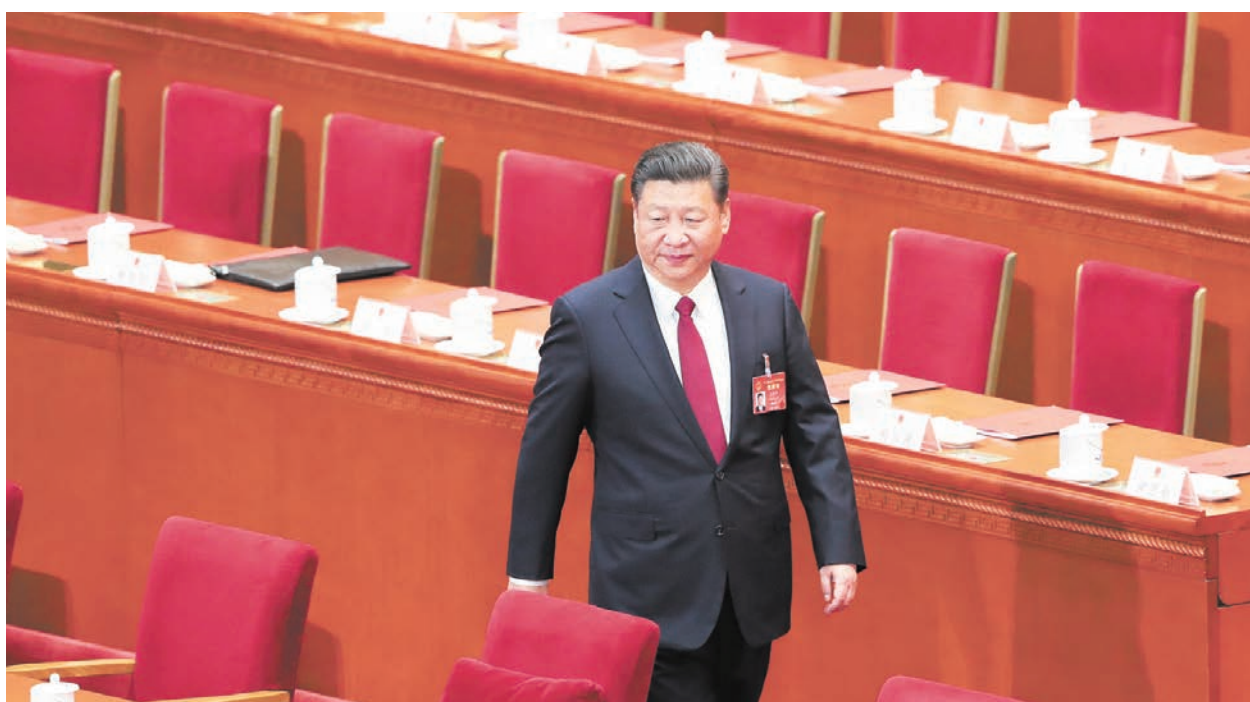
習近平再採取多項措施，進一步緊控軍隊。

導幹部經濟責任審計規定》，自7月1日起施行。該《規定》稱審計監督無禁區、無盲區、無例外，明確軍隊和武警部隊擔任領導職務、負有經濟責任的領導幹部全部納入審計對象範圍。