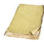
城隍有專司人間善惡之生死簿。