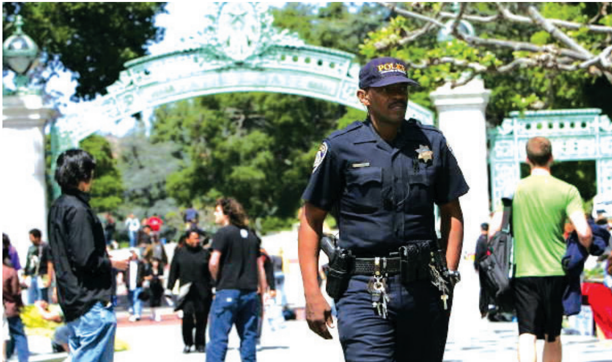
一名警察在加州柏克萊大學的 Sproul Plaza 巡邏。

自從非裔男子弗洛伊德死亡事件之後，“黑命貴”就一直在全美號召解散警局，稱警察機構是一個“不受監管的極端白人主義至上組織”。不過，據維基百科數據，2019年，洛市警局約萬名警員中，拉丁裔和非裔警員占到了約60%，白人警員只有約31%，亞裔和菲律賓裔佔約10%。