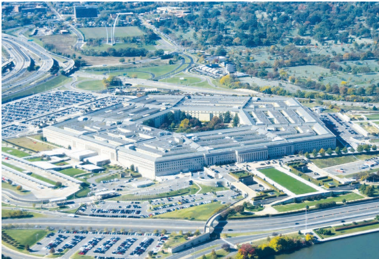
美國國防部總部位於五角大樓（The Pentagon）。

（IEEPA）懲罰在美國境內運營的中共軍方公司。在《國際緊急經濟權力法》下，通常美國財政部會宣布政府的制裁措施，切斷受制裁的外國企業和個人與美國金融體系的聯繫。