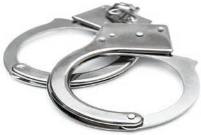
冥間對於殺人致死十分看重，重重審訊，絕不輕放！