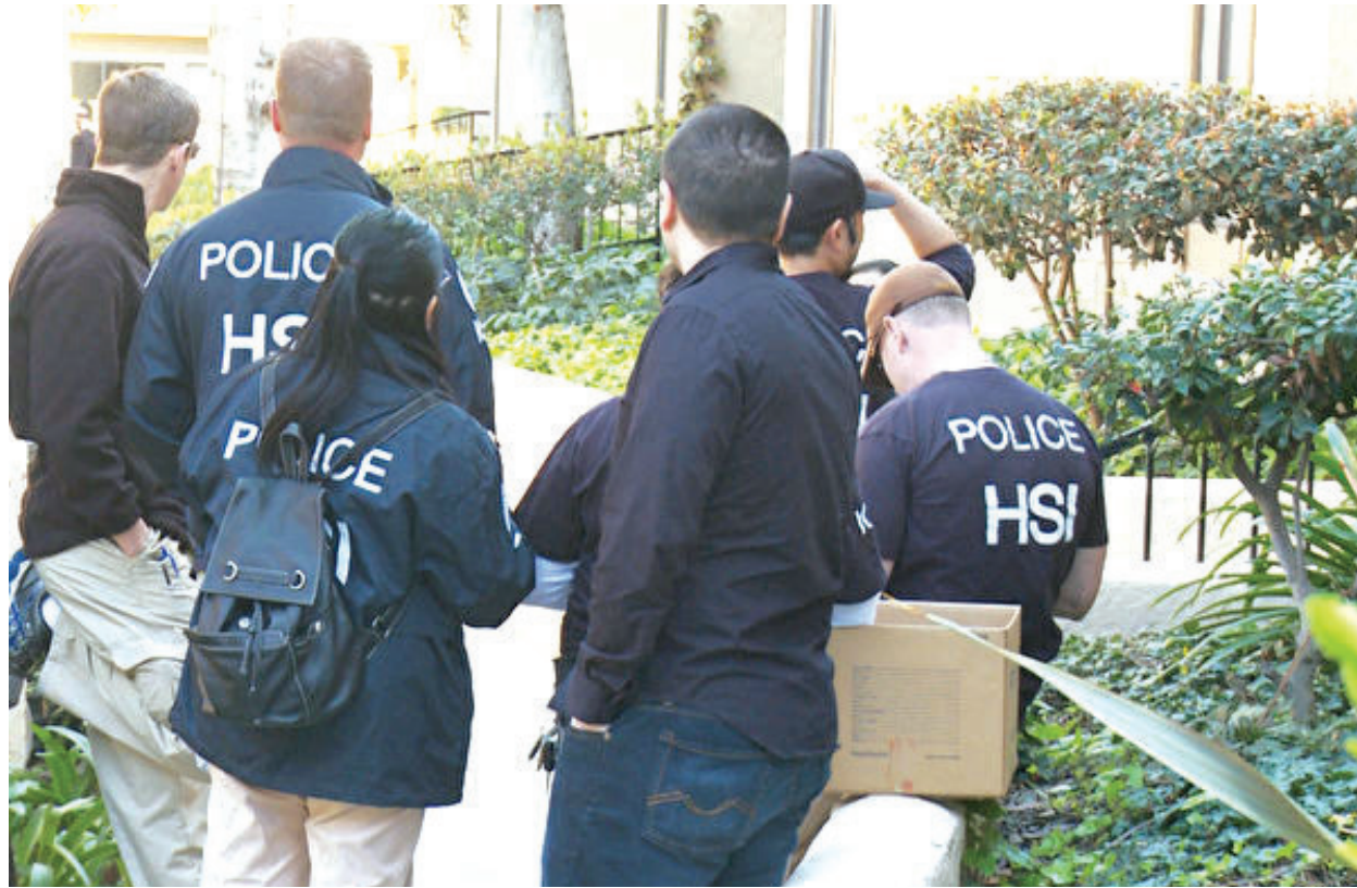
2015年被搜查的月子中心之一，位於羅蘭崗的Pheasant Ridge豪華公寓。

「優孕」的廣告稱，其在中國和美國有百人團隊為超過500名中國孕婦來美產子提供服務。訴訟文件說，該月子中心在爾灣有20套公寓，對每位客戶收取4萬到20萬美元不等的費用，僅僅兩