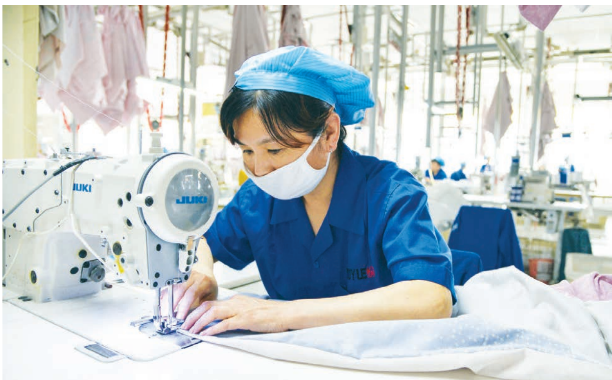
受疫情影響，外貿形勢嚴峻複雜，90%的外貿企業將面臨破產。

6 月 29 日，中共官媒中國新聞網報導稱，第 127 屆廣交會首次在網上舉辦，海內外近 2.6 萬家企業上線參展。