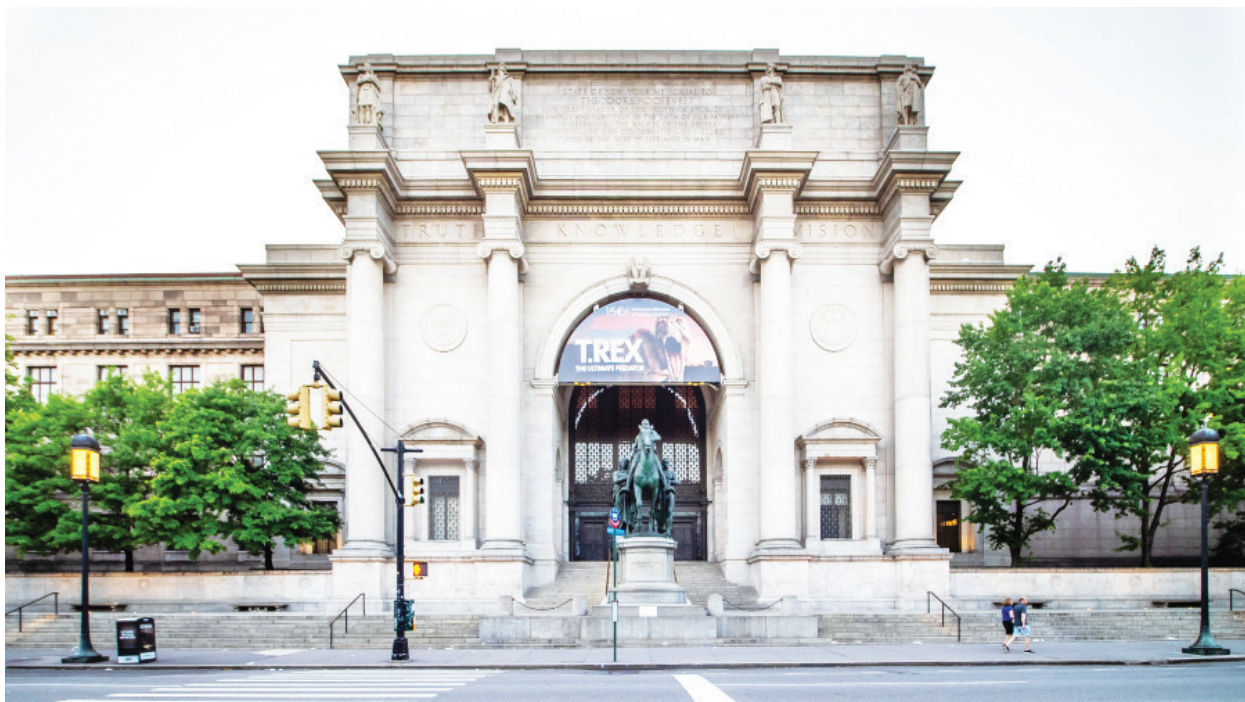
位於紐約的美國自然歷史博物館的西大門。門前可見一座包括西奧多·羅斯福在內的紀念雕像。

他接著說：「我們必須意識到，實際上那（文革運動）只關乎一件事，只有一件事，權力。」