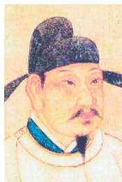
唐玄宗弄清事情真相之後，將奸臣杖殺，追贈顏杲卿為太子太保，謚忠節。