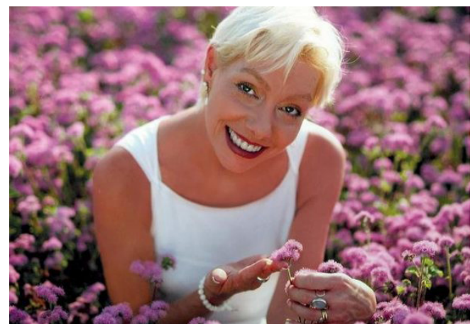
奧妮克來自金星，來到地球公布外星人真相。

在一次採訪中，在被問到金星人是否有神的概念時，奧妮克說：「是的，我們相信只有一個能量源頭，我們稱這能量源頭為萬物存在的肇因。因為祂從祂