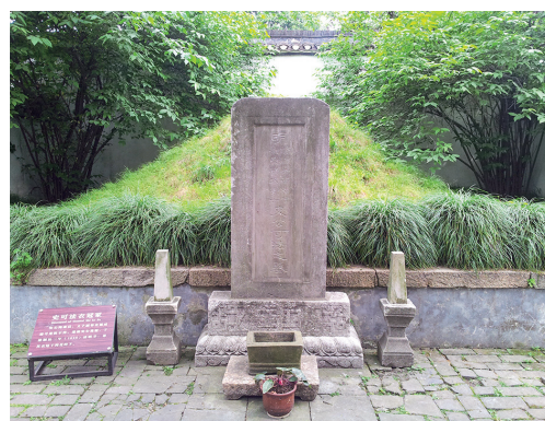
▲揚州城外梅花嶺史可法衣冠塚。