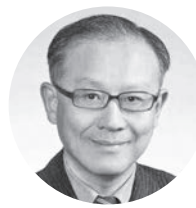
盧焱 上海楊浦區 政法委書記