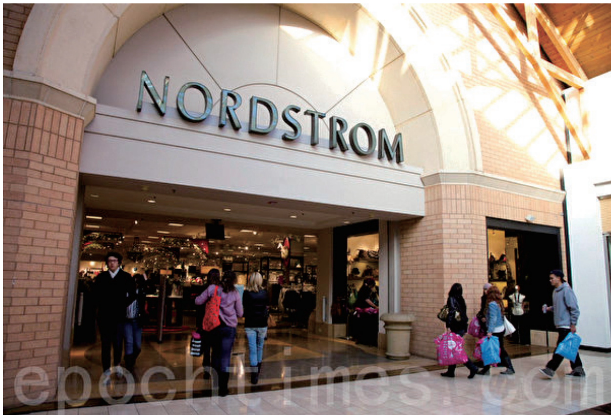
南加州一家 Nordstrom 百貨商店。

摩爾聯繫了附近城市警局，試圖了解最近動態、犯罪地點和方式，以及這些警察部門是如何應對的。