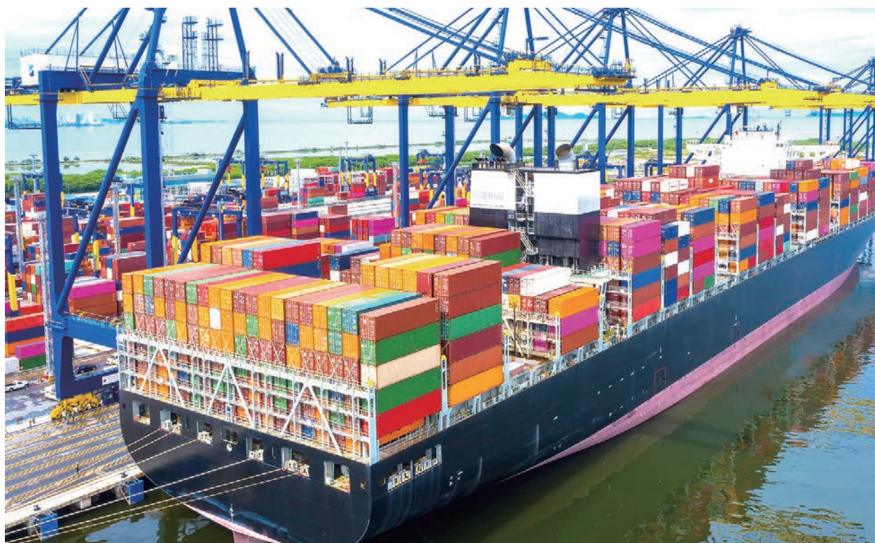
臺美貿易關係日漸熱絡。目前臺灣是美國的第八大貿易夥伴。

《自由時報》報導稱，針對本次「臺美科技貿易暨投資合作架構」，臺灣經濟部表示，這是臺美高階官員經貿對話，對臺美經貿發展具有指標意義。