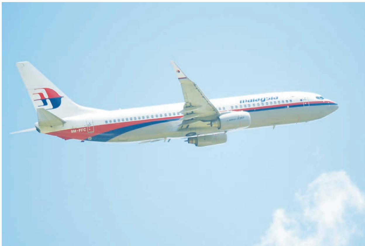
馬來西亞航空班機示意圖

不僅如此，令人感到驚訝的是，馬航MH370客機「失蹤」後，北京方面態度異常。2014年12月31日，大陸媒體「澎湃新聞」發表長文稱：「種種跡象表明，整個事