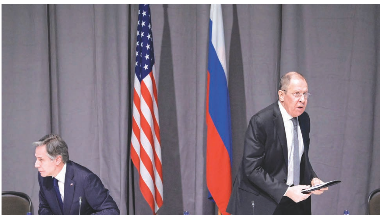
12月2日，美卿布林肯與俄外長拉夫羅夫，於斯德哥爾摩協商烏東危機，雙方歧見仍深。

拜登12月3日晚間，重申了他對俄羅斯挑釁行為的擔憂。拜登說：「對普京來說，如果他真的入侵（烏克蘭），這種賭博的風險將是巨大的。」3日早些時候，拜登承諾將使普京在烏克蘭採取軍事行動變得「非常、非常困難」，並表示，他的政府提出的新舉措，旨在阻止俄羅斯的侵略。