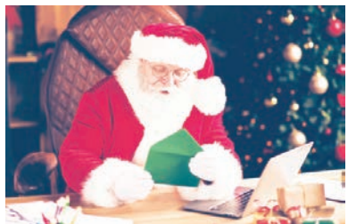
聖誕老人

【看中國記者心怡綜合報導】美國郵政(USPS)12月3日在加州橙縣塔斯汀郵局舉辦「給聖誕老人寫信」活動，前來參加的孩子們練習如何寫信，還和聖誕老人合影，大家都很开心。