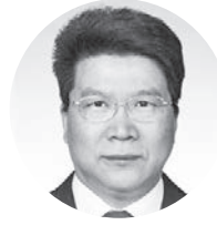
任湧飛 上海楊浦區 法院院長