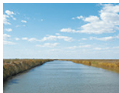
人類基因數據，以及今天這一地區居民的基因進行比照，結果證實：日本和朝鮮半島居民的祖先來自西遼河流域。

此前學術界一直認為：泛歐亞語系語言使用者之間沒有基因關聯。科學家們通過分析 23 具出土遺骸的基因，將其與現存的 9500 年前生活在東亞和北亞的