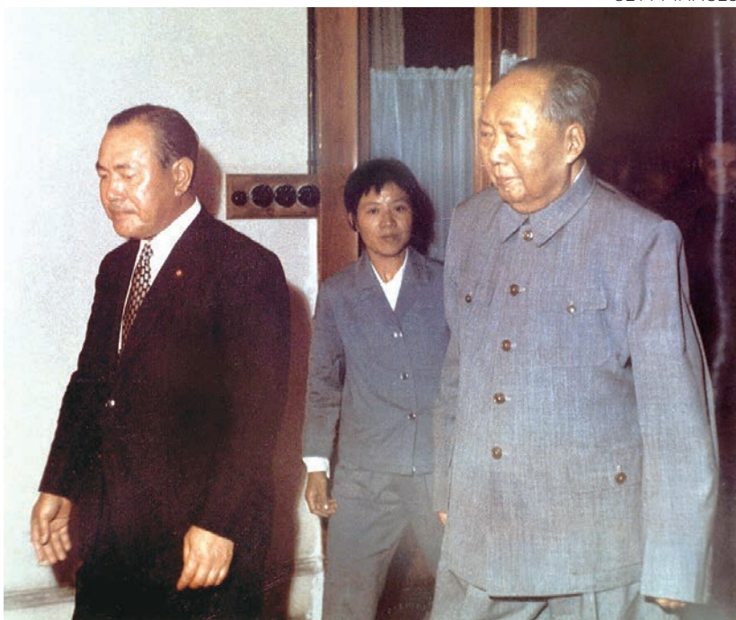
▲ 1972年9月，日本首相田中角榮（左）訪問中國，與毛澤東會面，並正式與中共建交。

東的偉大事跡。有幾件我印象很深。一個是毛澤東特別簡樸，生活非常樸素、簡單，平時不吃肉，只有工作特別累，腦子特別累的情況下才會讓工作人員給他燉點肥肉，補補腦子。