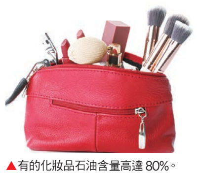
▲有的化妝品石油含量高達 80%。

因此，我們嘗試研究非人類物種會否有同樣的行為。最後發現狗和猴子也會對樂於分享、助人的人類有好感，對自私的人反感。」