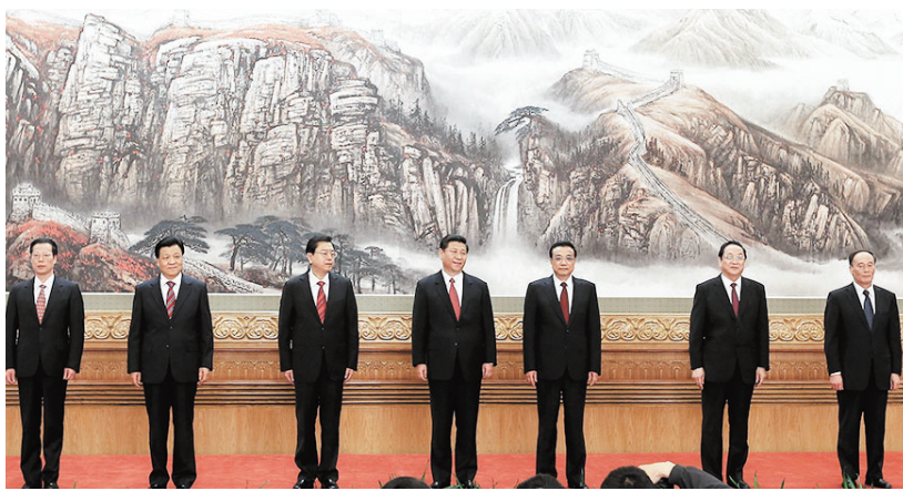
2012年中共常委亮相，張高麗在左首第一位。

但就是這樣一位中共領袖人物，在65歲時性侵犯彭帥，72歲時選色心不死，騙彭帥做其情人3年，甚至連張高麗的妻子在這過