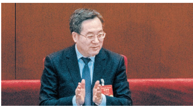
丁薛祥在今年3月的兩會上。

香港《明報》此前曾發評論文章稱，若丁薛祥在二十大上「入常」，很可能是王滬寧的接班