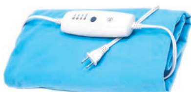
▲使用電熱毯時，要避免低溫燙傷。