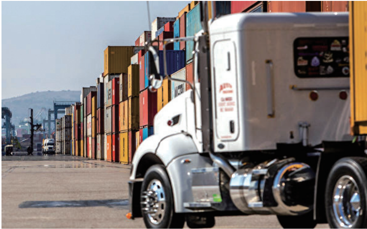
2021年11月17日在加州洛杉磯港，一輛運貨卡車停在集裝箱附近。

長灘市市長羅伯特·加西亞(Robert Garcia)在會議結束後在推特發布消息說：“感謝州長今天參觀了長灘港和洛杉磯港。我們正在與州政府和拜登-哈里斯政府合作，以緩解擁堵並重建我們的基礎設施。我們已經看到停靠在碼頭上