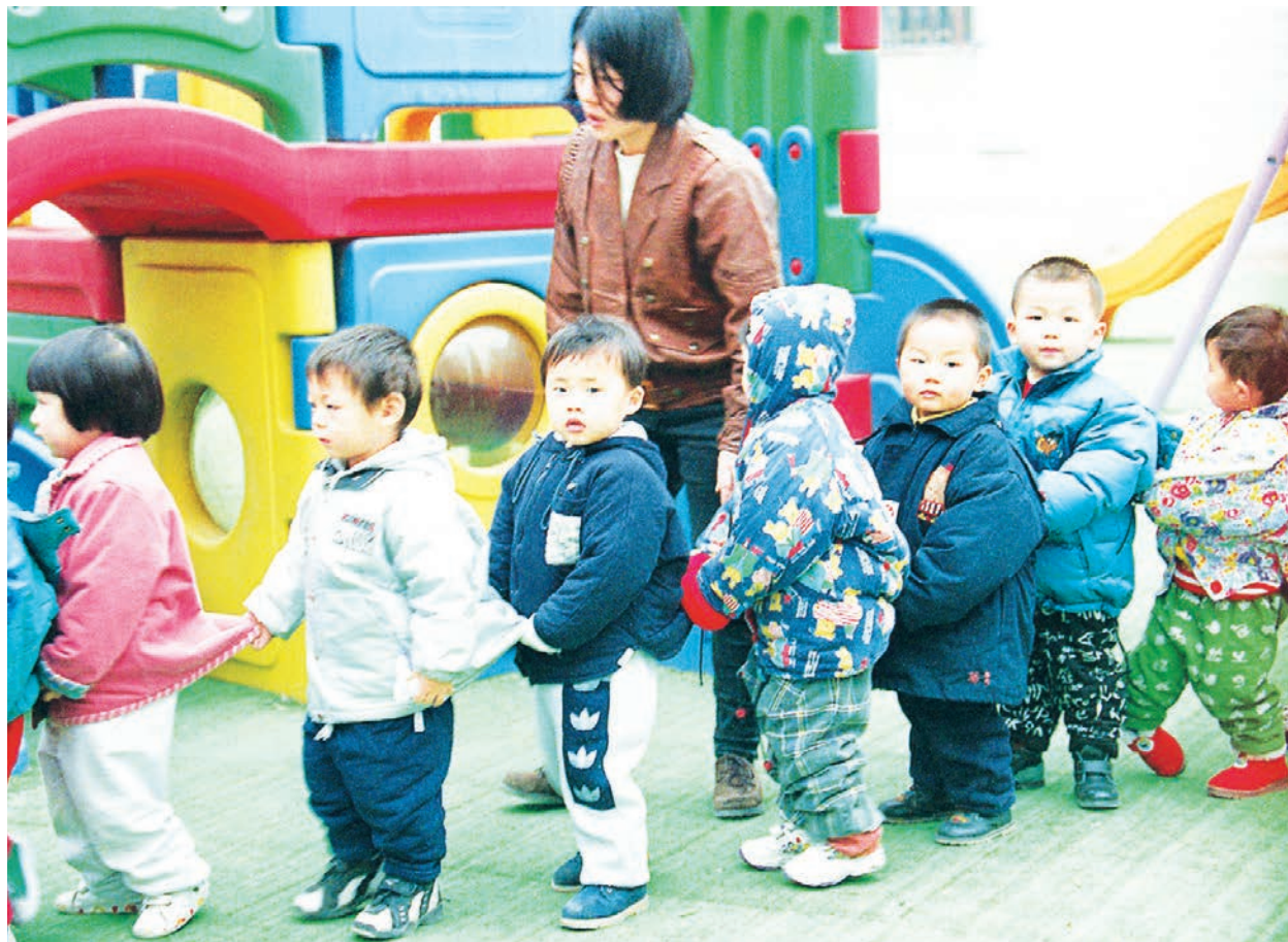
幼兒園的孩子們

《中國新聞周刊》報導，中國人口學會副會長、北京大學社會學系教授陸杰華表示，這是1949年以