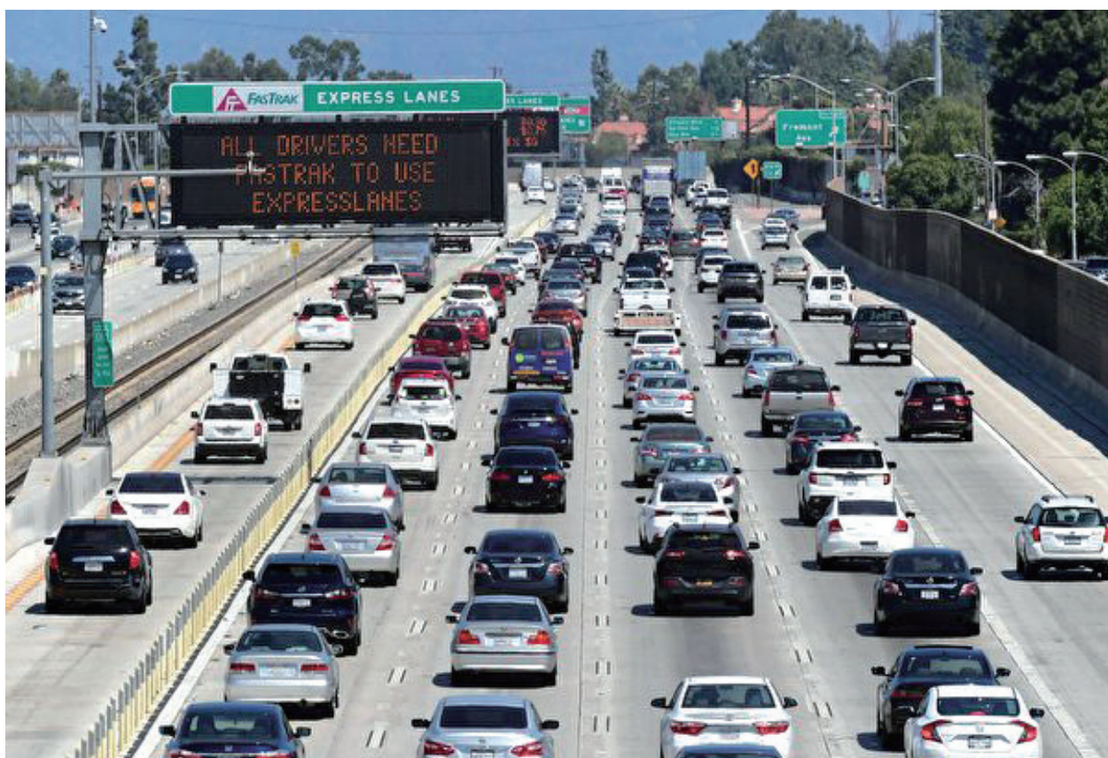
2019年9月18日，洛杉磯10號州際高速公路上的車流。

洛杉磯縣衛生官員提醒感恩節之後流行病例的潛在激增。去年12月是洛縣中共病毒(COVID-19)疫情死亡的最高峰，正發生在疫情爆發以來第一