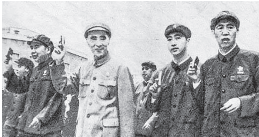
▲林彪(右三)與林立果(右二)

死了，侄子能力一般，如果權力交給林彪，未來毛家的天下恐怕要姓林了。儘管林立果行為低調，做事不太張揚，但是林身邊的助手都指著他將來掌權，林立果當頭之後他們也能雞犬升天，結果沒想到令毛澤東忌憚。