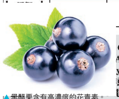
▲黑醋栗含有高濃度的花青素。