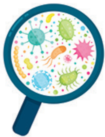
▲細菌之於人體，必不可少。