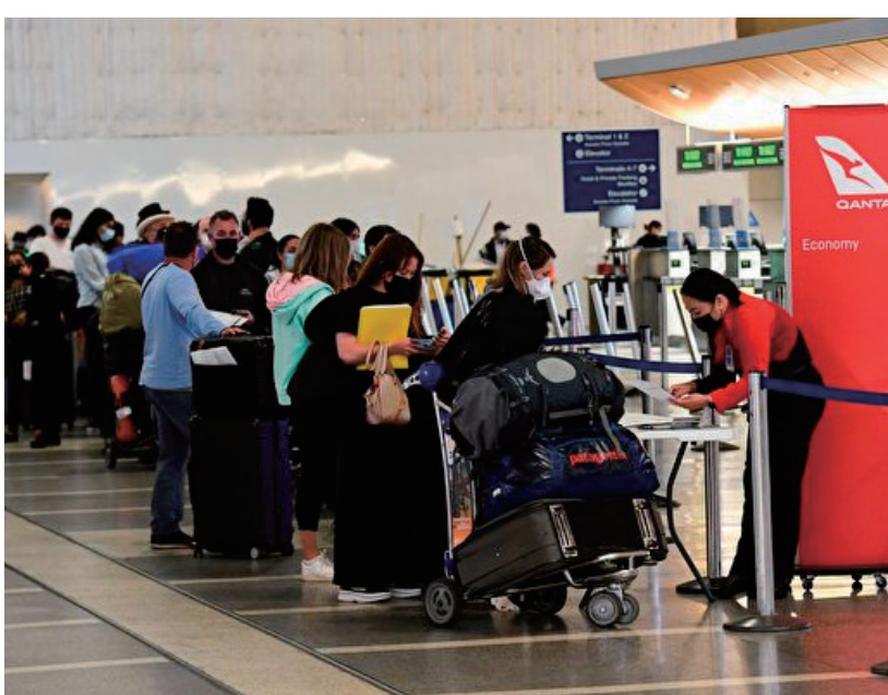
2021年11月，旅客在洛杉磯國際機場國際航站樓內排隊等待驗證他們的Covid-19疫苗接種狀況。