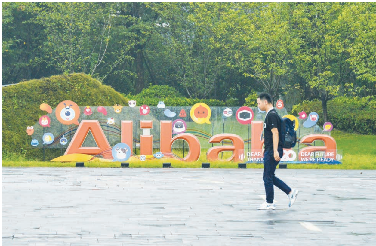
11月23日，北京官方約談阿里雲、百度雲兩家企業負責人。

算市場排名，截至今年6月，阿里雲、華為雲、騰訊雲和百度雲分別以33.8%、19.3%、18.8%、7.8%的市占率位列前四名。其中，百度雲的增速高於整體市場增速，同時也高於四大雲服務提供商的總體增長率。