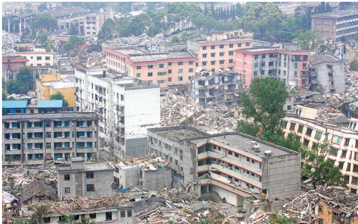
2008年汶川地震後的現場照片。