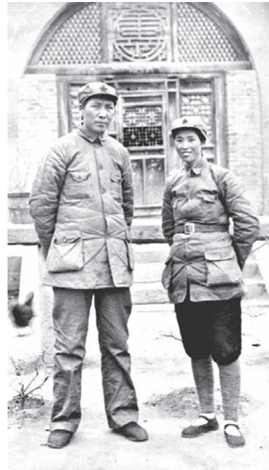
▲1937年，毛澤東和賀子珍在延安。 ▼1946年，毛澤東與江青。

興將毛澤東的所有醫療紀錄交給了李。李志綏發現毛的牙齒感染很嚴重，他開始檢查毛的牙、髮、囊腺和胰腺，檢查中李發現毛的右睪丸不正常下垂。女作家石文安在書中寫道，也許是驚人的巧合，拿破崙和希特勒也有過與毛同樣的症狀，可謂帝王一絕。