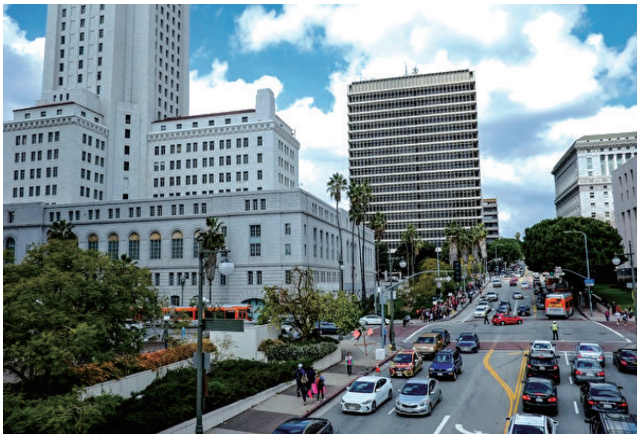
洛杉磯市政廳。

“我們依照當地對（顧客）接種疫苗的規定，在商店清楚並且正確地張貼了標誌，傳達了政府的要求。” In-N-Out 在聲明中表示，“我們不會成為任何政府的疫苗接種壓力，強迫我們的餐廳員工將顧客分為可以接受服務的人和不可以接受服務的人，無論是