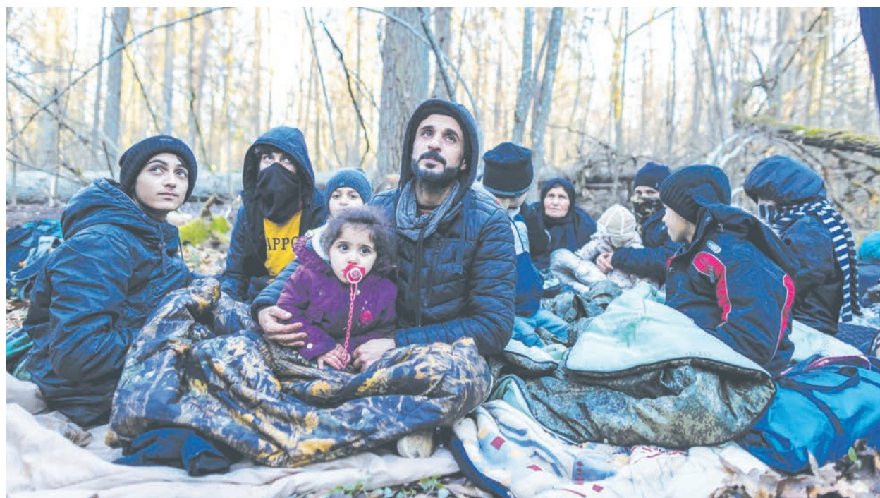
自土耳其遭白俄誘騙至白波邊境的庫德族難民，被丟棄在天氣惡劣的原始森林進退不得。

【看中國記者萬厚德綜合報導】在白俄羅斯的「中介」安排下，來自土耳其的大批中東難民正試圖經由白俄邊境湧入波蘭與立陶宛境內，成為白俄報復歐盟對其制裁的人肉武器。波蘭國防部並增派近萬名軍人增援邊境，並於8日上午於東部邊境攔截數千名正從白俄突破邊境隔離網、試圖非法入侵的中東難民。但在邊境沿線，還有上萬名難民在白俄軍警驅趕下，進退不得地與波蘭軍警對峙。