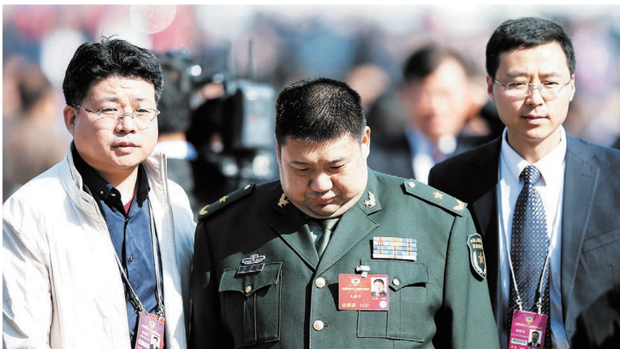
毛澤東妻子楊開慧誕辰120週年之際，毛新宇高調悼念。

1923年至1927年，楊開慧隨毛澤東在上海、韶山、武漢等地開展政治活動。1927年，毛澤東準備組織秋收起義，後上井冈山，