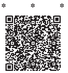
穴位圖：溫嬭容醫師提供；其他圖片：ADOBE STOCK