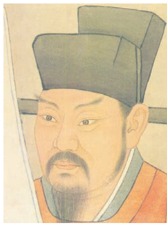
▲王安石，為韓琦幕僚。