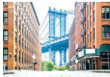
布魯克林

威廉斯堡儲蓄銀行大廈(Williamsburgh Savings Bank Tower)建於1929年，80年來一直是布魯克林最高的建築，但