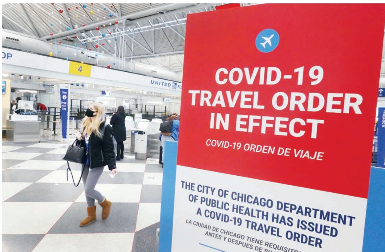
近兩年的管制後，美國於11月8日向完全接種COVID-19疫苗的國際旅客重新開放國門。圖為芝加哥機場

於上午10:30左右抵達肯尼迪機場，其他航班從孟買和德里飛往新澤西州的紐瓦克。不過，當他們降落時，還有數百人在慕尼黑和阿姆斯特丹機場的荷航和漢莎航空櫃檯辦理登機手續。