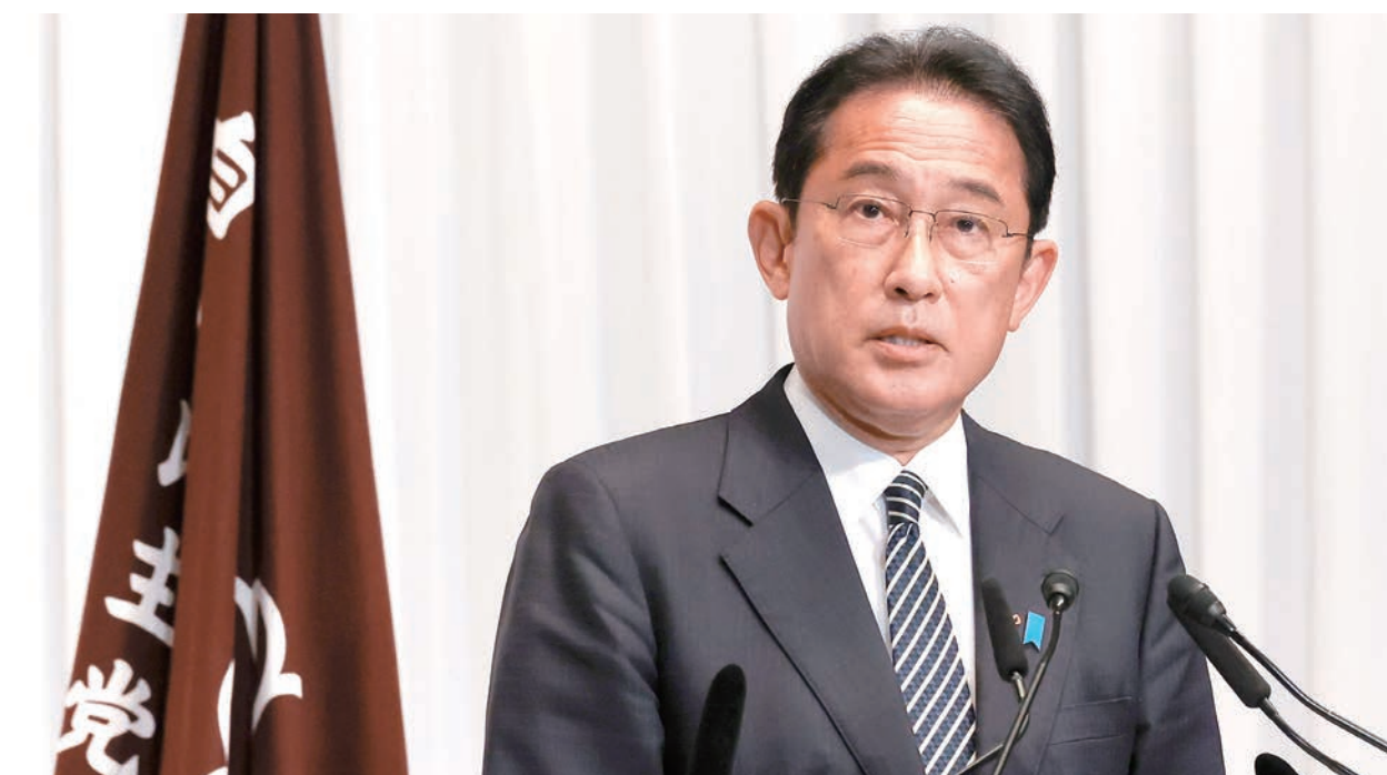
臺灣日本研究院舉辦座談會，並討論日本的首相岸田文雄在確保執政優勢後未來政策動向。

要以國家的整體力量去達成。CPTPP 跟供應鏈強韌化關連，因為在此規範下，彼此合作將受到某種程度的保障，而不會受政治因素影響。他期望，未來臺日能建立對話機制。