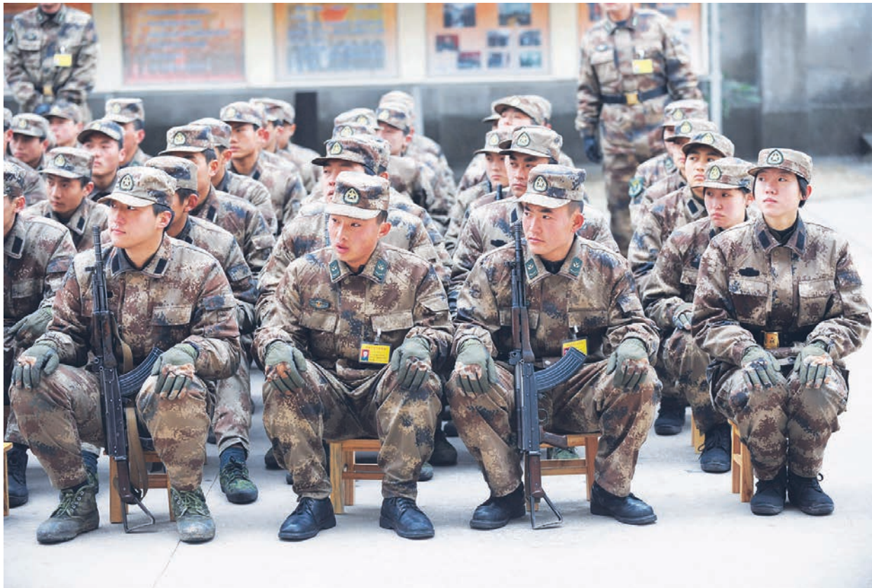
中國軍人

一位中國問題專家表示，1998年之前，一些排長連長退役後，可以降半級進入地方的企業單位工作，但是現在團級幹部到地方也找不到工作。他表示，近年來