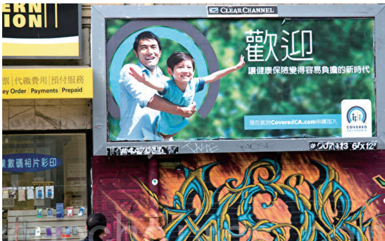
加州全保的廣告牌。

彼得·李也建議民眾在截止日前儘早申請，為個人和家人選擇可負擔的健康保險。如果民眾希望自身的保險從明年 1 月 1 日開始生效，