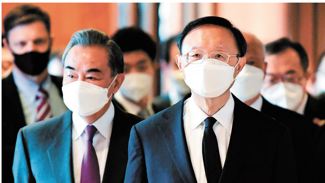
中共中央外事辦主任楊潔篪（右）與外交部長王毅（左）於今年3月在美國阿拉斯加。

習近平掌權後，逐漸放棄鄧小平提出的「韜光養晦」的外交策略，中共外交畫風逐漸轉向強硬，表現出咄咄逼人、不可一世的「狼性」。2021年3月17日在阿拉斯加，中美舉行了拜登政府上臺後的首輪高級別外交官員會晤。楊潔篪竟然用長達15分鐘的發言猛烈抨擊他所說的美國問題，並說：你們沒有資格在中國的面前說，現在中國人是不吃這