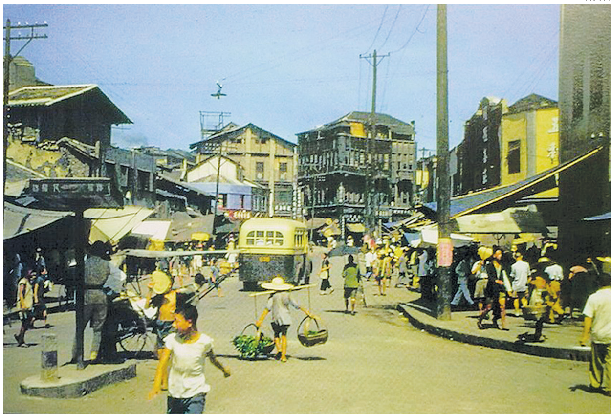
▲1944年抗戰時期的重慶街道

辛亥革命元老夏之時也是一個。夏之時曾任成都革命軍總指揮、蜀軍總司令。30年代退出政界，回到家鄉合江，潛心研究佛學。中共殺他，為的是湊夠毛