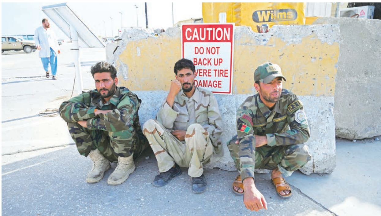
美軍2日撤離最大空軍基地巴格拉姆，三位士氣低落的政府軍神情無助地蹲踞在基地入口處。

【看中國記者萬厚德/成容綜合報導】美國和北約部隊已於2日正式撤離美國在阿富汗最大的空軍基地，這項撤軍行動意味著美國在一個戰略要衝上軍事存在的結束。近20年來，巴格拉姆一直是對塔利班和其他伊斯蘭激進武裝團體進行軍事打擊的集結點，面對塔利班的狂飆猛攻，政府軍是否具有守住這一戰略要地的能力，已成為能否防止首都喀布爾再次淪陷的關鍵。北京方面則覬覦美軍撤離後的運作空間，刻正與塔利班展開談判。