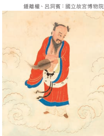
鍾離權、呂洞賓：國立故宮博物院