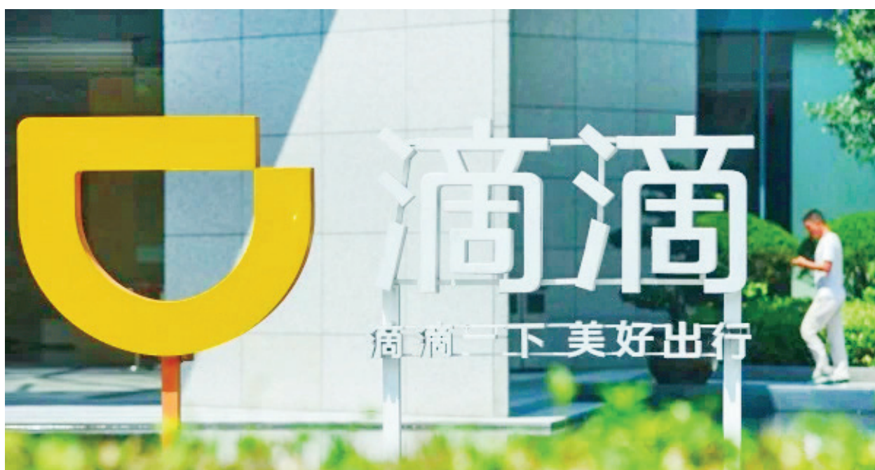
美國律師事務所也要對滴滴發起集體訴訟。

據美國商業資訊（Business Wire）報導，美國股東權益律師事務所（Labaton Sucharow LLP）以及羅森律師事務所（Rosen Law Firm）宣布，正在代表滴滴全球股份有限公司的股東調查潛在的證券投資風險。此