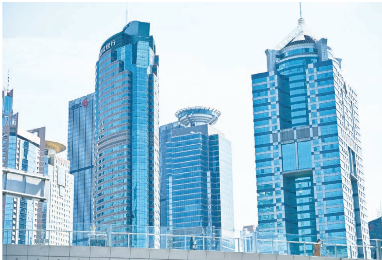
北京最高層級文件發布，更多公司將有大麻煩。

該文件還提及查處金融風險背後的各種腐敗問題，同時注重防範腐敗案件可能誘發的資本市場風險。