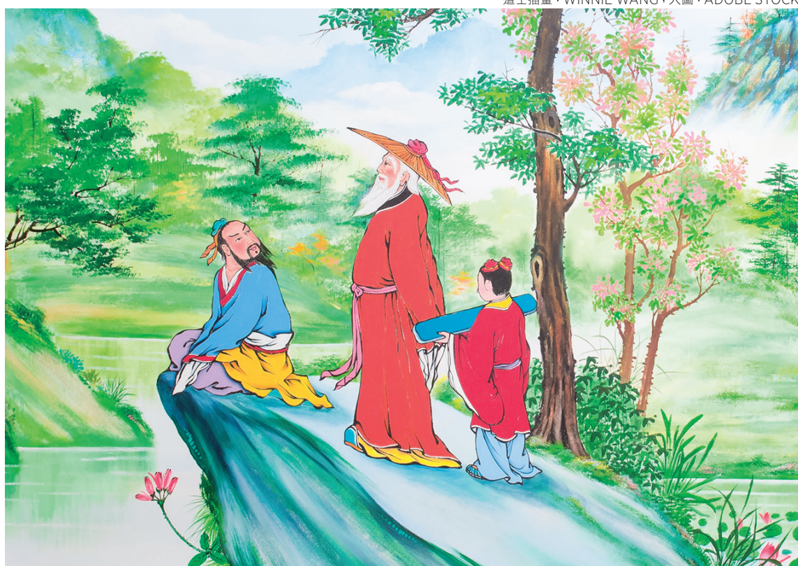
道士插畫：WINNIE WANG；大圖：ADOBE STOCK

古戰場上硝煙滾滾，將軍與一名士兵正奮力廝殺，不遠處，亂箭已穿過濃煙急速向二人逼來。將軍與士兵驚想：「今生將葬身此地也！」就在千鈞一髮的生死關頭，不知從哪裡冒出一位白鬚道士，舞動拂塵，瞬間將箭簇撥落，救了二人性命。