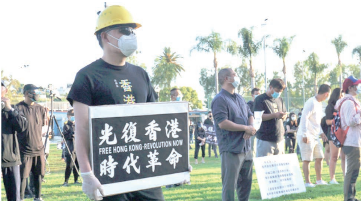
2020年7月1日，上百名香港人在洛杉磯一公園內集會，抗議北京強行通過《港區國安法》。

【看中國記者李懷橋綜合報導】《港區國安法》實施後，社會自由遭到前所未有地壓制，不少港人紛紛逃亡海外，繼續在西方自由社會為香港抗爭。日前，流亡澳洲的香港前立法會議員許智峯參加網上論壇，他批評指，習近平自誇強大，哪有強大國家如此害怕自己的人民。他還指，目前海外港人的抗爭目標已不再滿足於恢復「一國兩制」和「有限度的民主」，而是要解體共產黨，這樣才可以真正光復香港。