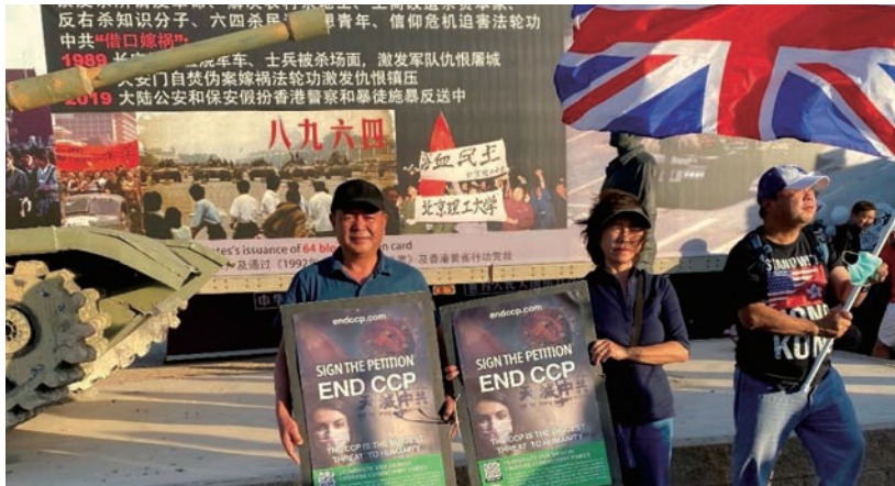
作者參加2021年紀念八九-六四活動。

89年5月底，我接到單位通知去河北廊坊開會，6月1日我從成都乘火車途徑北京轉車之際我去了天安門廣場。走進廣場我立刻被這個巨大的場所震撼了，廣場內旗幟和標語交錯飄揚，北京各大高校的學生和教師以及社會各屆人士至少好幾萬