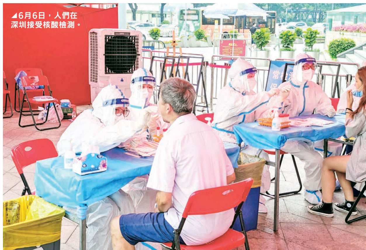
▲6月6日，人們在深圳接受核酸檢測。

月7日通報，過去一天新增1212例COVID-19確診病例，時隔半年，日增病例再度破千。