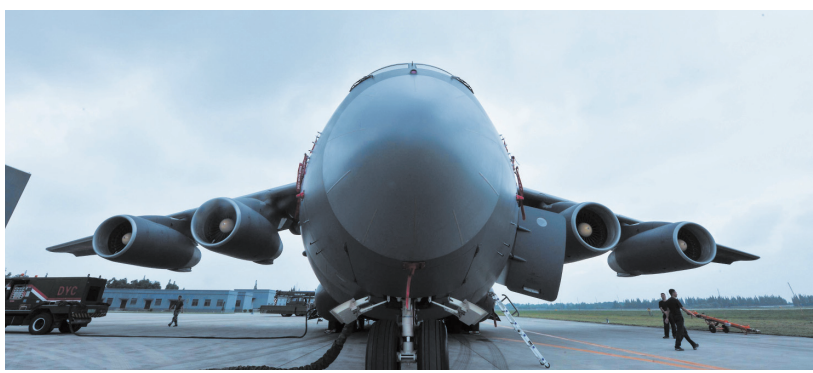
運-20運輸機

中航飛機12月10日通過《中國證券報》等平臺發布公告：中航飛機股份有限公司董事、副總經理李守澤於12月6日「不幸去世」。公告稱，李守澤去世後，公司現任董事會成員由14名變為13名，未低於法定最低人數。公司將根據相關規定，按照相關程序增補新的公司董事並及時公告。