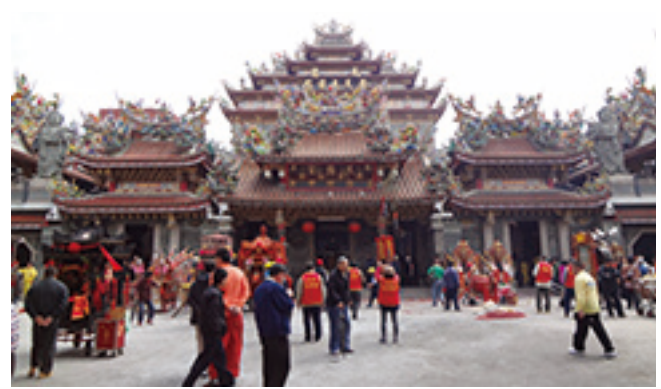
北港武德宮正月初一降文出「年運鸞文」，吸引不少民眾目光。

專家也表示，以往來說，下面那段文的最後「春澤花潤春庭雨，水漬輕搖擺夷度」，過去並不會多增加這兩段，應該是神明想要再強調某件事情。