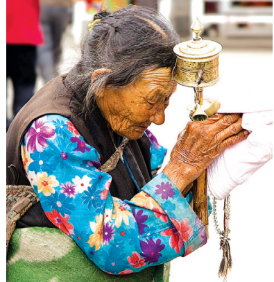
▲在拉薩街頭手持小型轉經筒祈禱的藏族婦女。