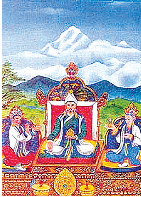
▲繪有松贊干布、文成公主、赤尊公主的唐卡。

賜給文成公主一尊釋迦牟尼佛像，為供奉這尊佛像，文成公主用大批山羊馱土填湖，修建了一座巨大的神殿，即今日的大昭寺。