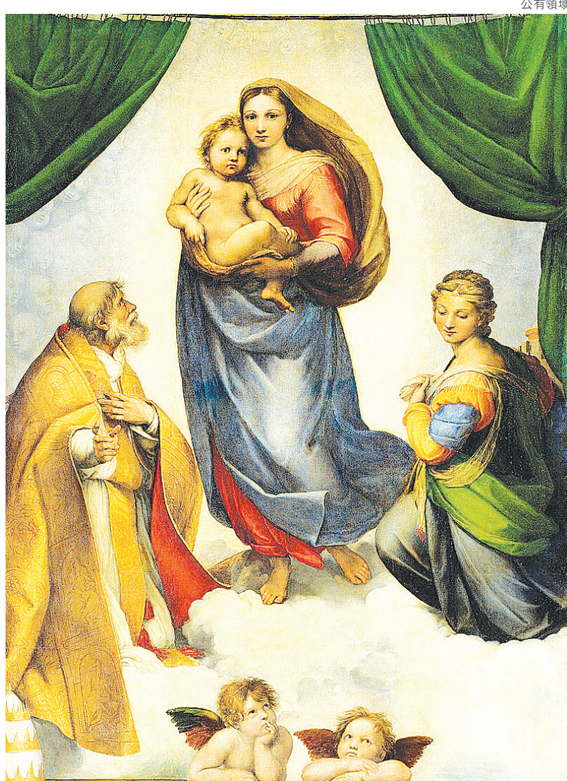
▲拉斐爾的〈西斯廷聖母〉

短短幾年，拉斐爾便對老師的模仿達到了出神入化、幾可亂真的境界。17歲時已經可以拿