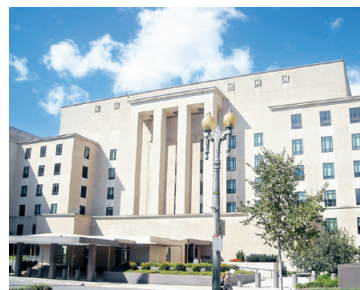
美國國務院

美國國務卿蓬佩奧也在一份聲明中說：「又一名美國人回家了。王夕越被伊朗以虛假的指控扣押了三年多，現在他已經獲釋，在返回美國途中。王先生不久將和他的妻子和兒子團聚。他