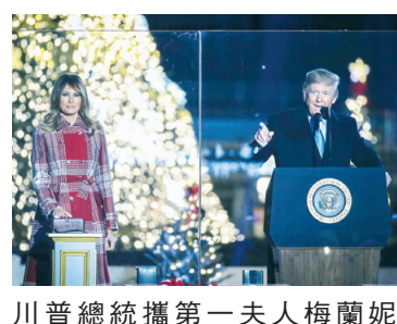
川普總統攜第一夫人梅蘭妮亞為聖誕樹點燈。

隨後，川普向來賓致謝，並對軍人表示感謝。他說：我們感謝那些英勇的退伍及現役軍人，沒人能與他們相提並論，他們激勵著我們所有的人。我們也要向