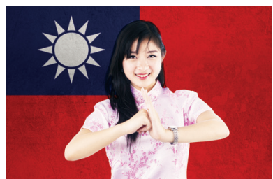
許多港人選擇移民到臺灣。

【看中國記者明思綜合報導】香港反送中運動延續至今已超過五個月，許多港人認為香港政治陰霾籠罩，已沒有自由，近日傳出許多富裕階層計畫移民歐美，也有許多港人選擇移民到臺灣。