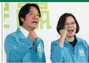
A8 臺灣政局疑雲密布 北京介入