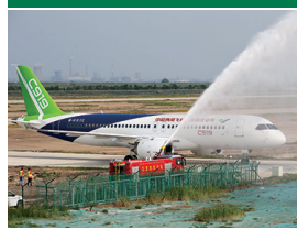
A7 大客機C919的 「自主研發」