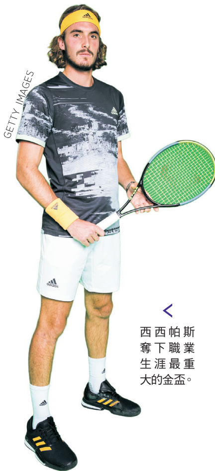
西西帕斯奪下職業生涯最重要的金盃。

有圈中人指她會由老公開設的事務所回歸藝能界，最快可在明年秋天有新作推出。堀北真希現正獲NHK及NTV電視臺招手擔任日劇主角，NHK更以大河劇來遊說她答應演出，就連米倉涼子主演的冠軍劇《Doctor-X》，以及明年4月開播的《半澤直樹2》，也曾邀堀北真希客串，更有電影徵她復出大銀幕。