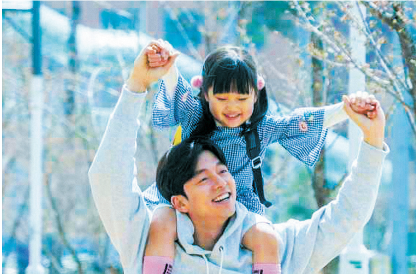
孔劉睽違3年，重返大銀幕，主演《82年生的金智英》，聽到網絡「仇女」用語備受衝擊。(車庫娛樂提供)

孔劉也說，自己平常就想很多，「拍攝《82年生的金智英》後，好像想得更多了，努力想整理自己的思緒」。他認為，自己個性還有不足，也有冷淡的一