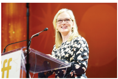
影星梅麗·史翠普

海外媒體報導,《洗鈔事務所》揭示了世界各國權貴財閥、政治人物通過洗錢,刻意在海外隱藏資產等內幕。資深影星梅麗·史翠普(Meryl Streep,梅姨)在影片中飾演女主角。影片在「第五個秘密:殺人」中,描述了2012年,重慶前市委書記薄熙來夫人谷開來因謀殺外國商人海伍德(Neil Heywood)被捕,薄熙來被抓捕等在中國發生的真實事件,並曝光了法輪功修煉者遭迫害,被活摘器官的真相。