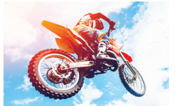
越野摩托車

黑德格臨危不懼,伸出一隻手臂艱難地抱住方向盤,打開汽車的雙閃燈,此時車速已達90英里。幸好有2名司機注意到了這輛車,他們跟上來與黑德格的車保持平行,透過車窗看到昏迷的女駕駛員,看到操控方向盤的是一個小男孩。一名司機急忙喊話,讓男孩把車開到前面不遠處路邊的草地。黑德格的車連續橫跨兩條車道,開到路邊的草地上,最終停了下來。