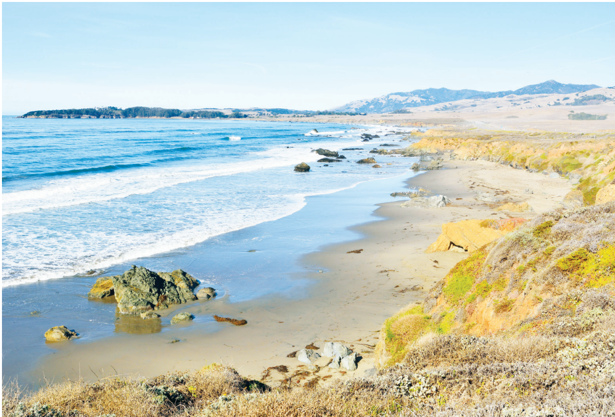
加州海灘