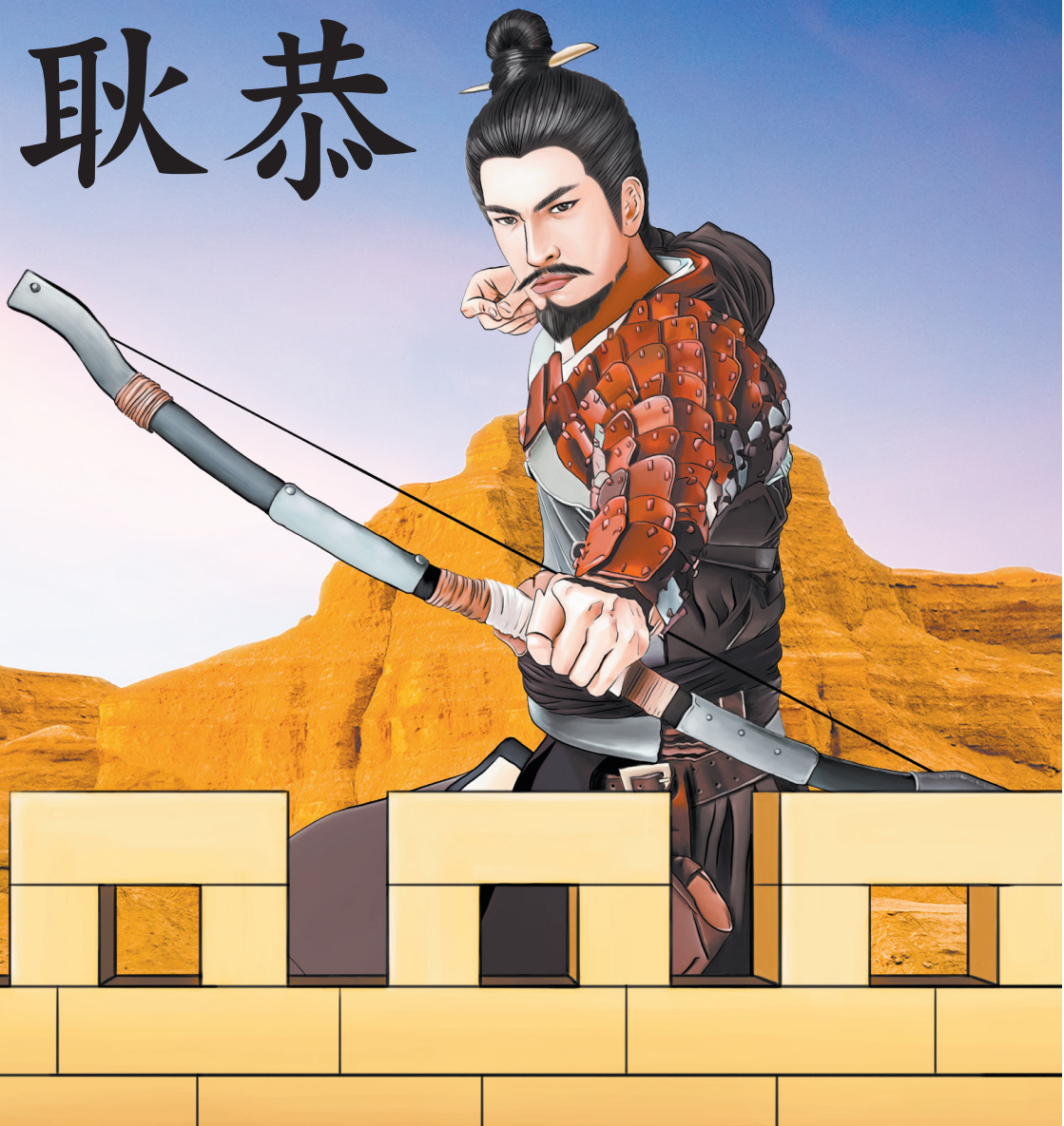
背景：FOTOLIA；插畫：WINNIE WANG；後漢書：公有領域；玉門關：TIM WANG/FLICKR/CC BY-SA