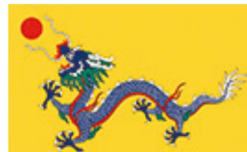
▲清朝的「黃龍旗」是中國歷史上真正意義的國旗。

他說：「請神容易送神難，這兒指怪力亂神。你把血旗一掛，就把它們請來了。中醫講，血是陰性的，在體內載氣，有能量，會聚集另外空間的低靈，這些低靈有的附到你身上，有的在住家下，現在你不想要了，說你們走吧，它們聽嗎！怎麼辦，就得硬趕。這些東西是陰性的物