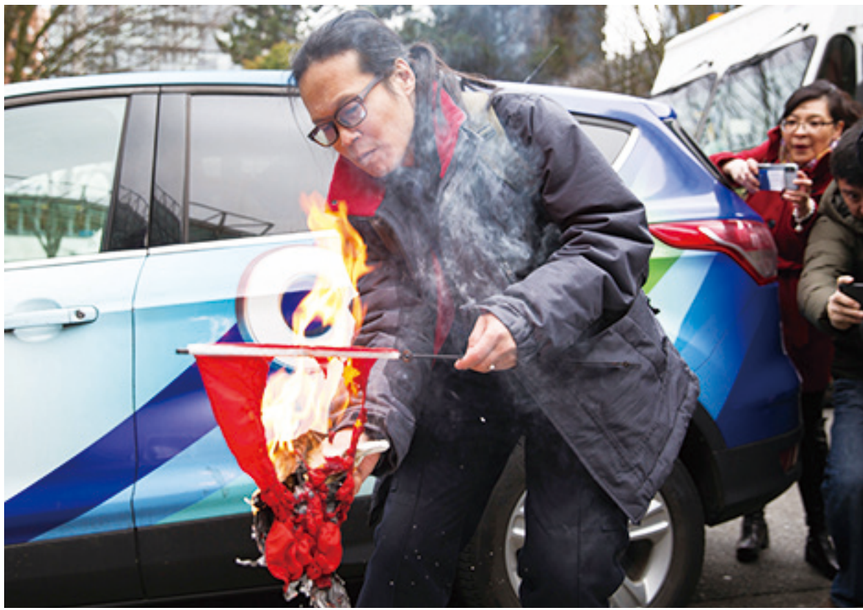
▲風水大師揭露，中共血旗背後藏有令人驚駭的祕密。

若配合色彩的形狀，青天則同時又象徵中華民族光明磊落、崇高偉大的人格與志氣；白日象徵光明坦白、大公無私的純正心地與思想；紅色象徵不畏犧牲、民生與博愛。反觀中共的五星旗，由一個大五角星、旁邊四個小五角星組成。根據中共的說法，大五角星代表中共，四顆小五角星代表工人、農民、小資產階級和民族資產階級。絲毫沒有表現自由的普世價值，也沒有表現民主的思想。而且每顆小星各有一個尖角正對大星中心點，表示全體人民如奴僕般臣服於旁，供奉著中共，中共駕凌在國家與人民之上。