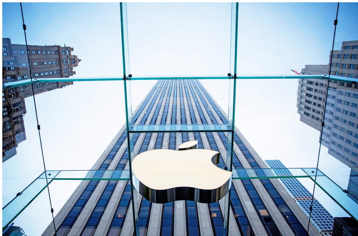
蘋果向騰訊傳送數據的歷史，已有兩年之久。

約翰霍普金斯大學教授兼加密專家葛林表示，該政策會將用戶試圖訪問的網頁及用戶的IP地址曝光。它還可能會在用戶使用的電子