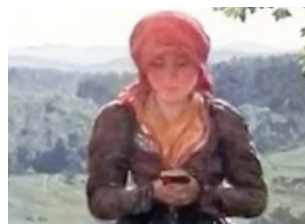
▲ 19 世紀的繪畫中，一位女士在走路時盯著「智能手機」。