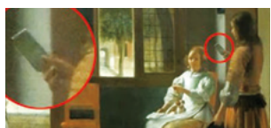
▲ 1670 年的名作「男人在房屋的入口處給女人寫信」。

還有一幅名為整〈品欽先生與定居斯普林菲爾德〉的壁畫，是意大利藝術家羅馬諾 1937 年的作品。畫中一名頭頂羽毛、下半身圍著白布的原住民，手中拿著黑色長方形物體，也像是現代人拿的手機一般。美國賓州大學教授布魯克表示：「真是像得可怕！不論是拿的動作和凝視的表情，確實就像是在看智慧型手機。」