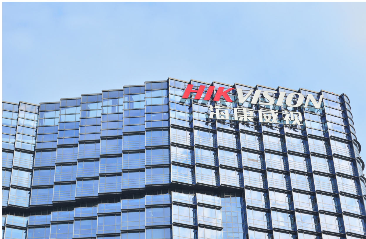
海康威視（公有領域）

元。據路透社報導，海康威視在8月分的500億元人民幣（合70億美元）收入中，有近30%來自海外。美國海康威視發言人7日晚間表示，該公司「強烈反對美國政府今天的決定」。