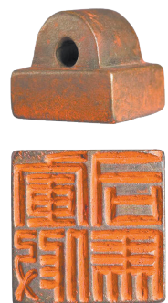
▲奉車都尉竇固任命班超為假司馬，圖為東漢假司馬印章。