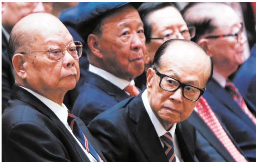
李嘉誠看到的未來不是「千年大計」。

熟悉李嘉誠的人士曾表示，他每天90%的時間，都在考慮未來的事情。雖然1928年出生的李嘉誠已經是91歲高齡，但他仍然需要思考未來，2015年他在《亞洲新聞週刊》上的一篇文章中說：「我也希望我的家人和我的商業在我故去之後，正常運轉，得到良