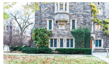
普林斯頓大學校園

而在最佳公立大學排行中，排名第一的是加州大學洛杉磯分校，第二名是同為加州大學體系的伯克利分校，第三則是密西根大學安娜堡分校。這三所學校在全國綜合大學的排名分別是第20、22和25名。