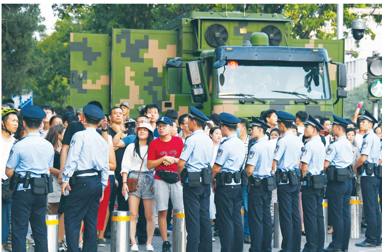
北京進行「十一閱兵」綵排，市中心多處封路。

閱兵綵排擾民，引發民眾不滿。網民紛紛留言表示，「本次閱兵勞民傷財顯然上了一個新臺階。」「十一假期未到，治安管理草木皆兵，擾民啊！」