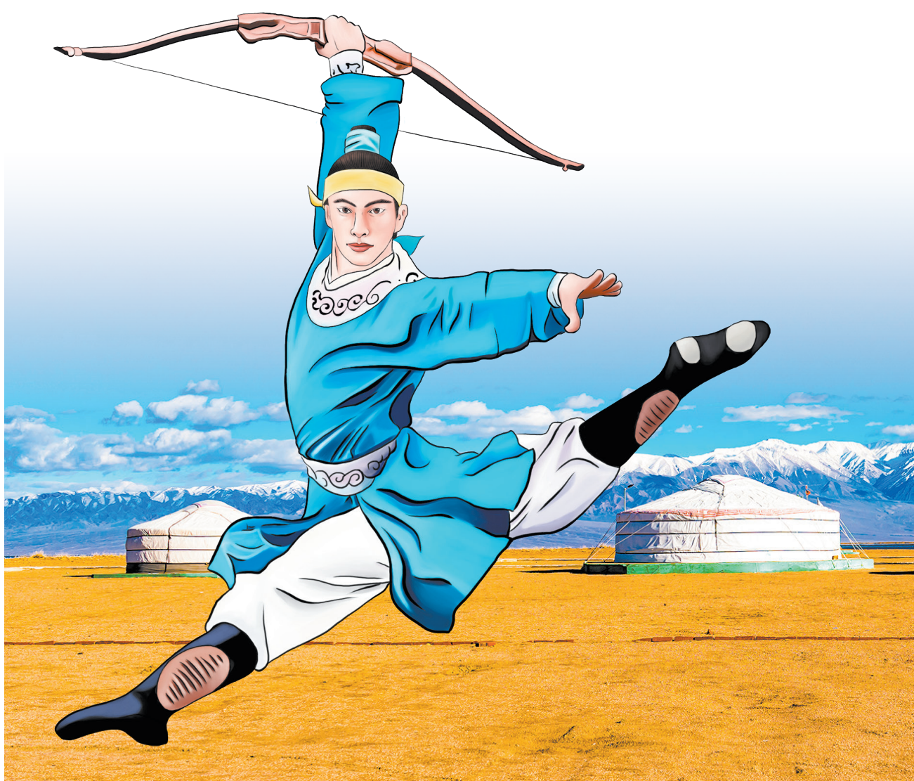
插畫：WINNIE WANG

所幸，每一次看完《神韻》，人間的夢境都會變得更加清晰、更加豐富、更加美好。作為一個追夢之人，願竭誠用詩的語言，把這夢境中的美表達出來，希望能夠予人憧憬——那比夢境更美的《神韻》，那宛若天堂的美。